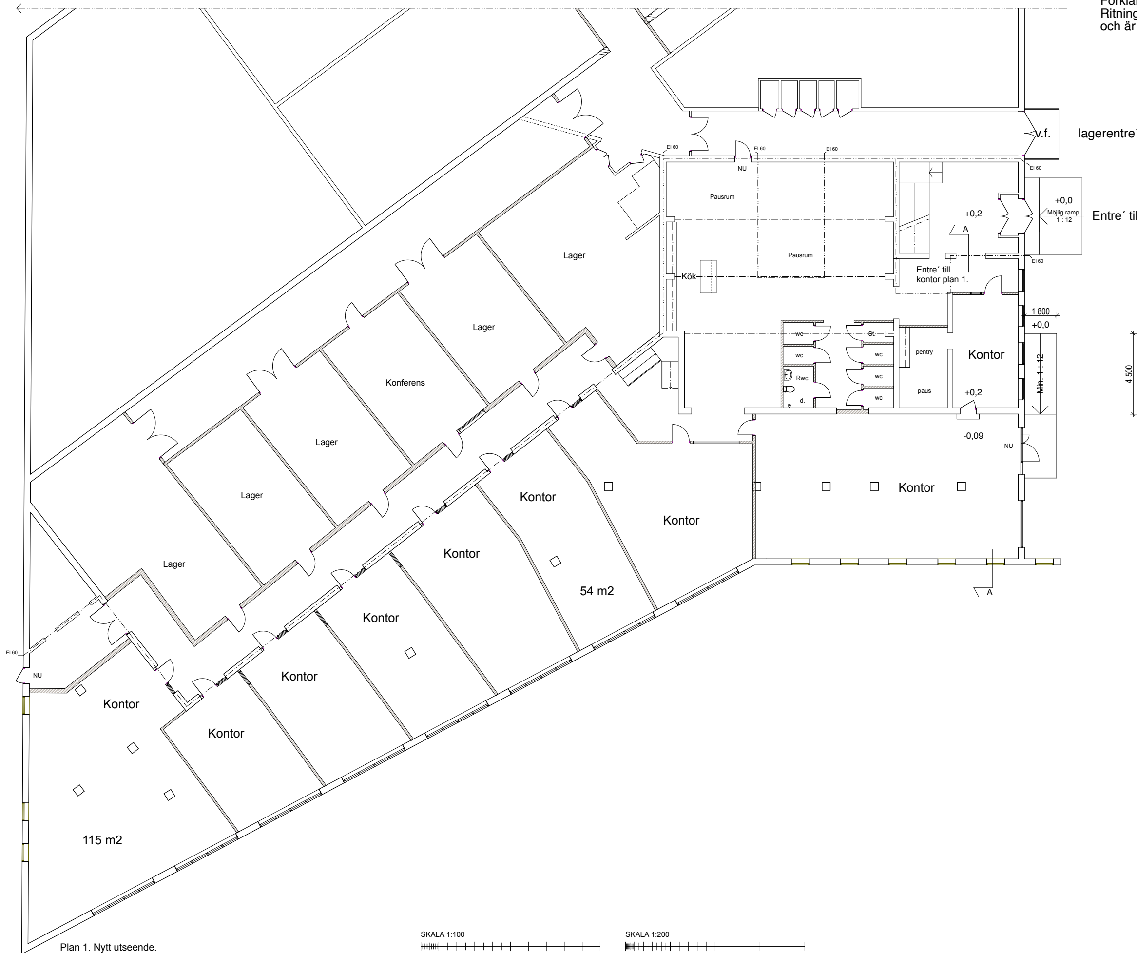
Plan 1. Nytt utseende. Skala 1:100