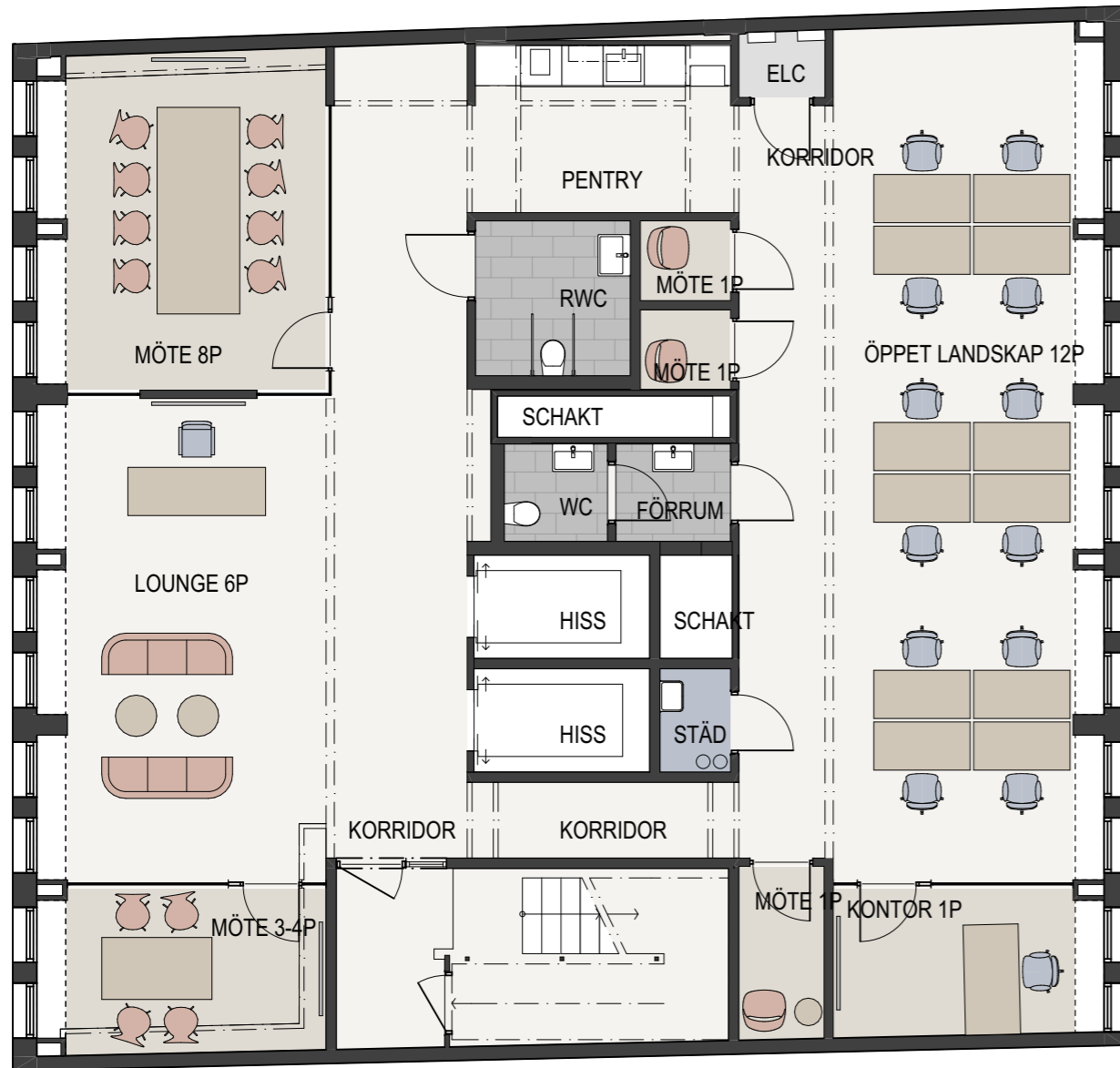
PLAN 9, 6 TR 1:100