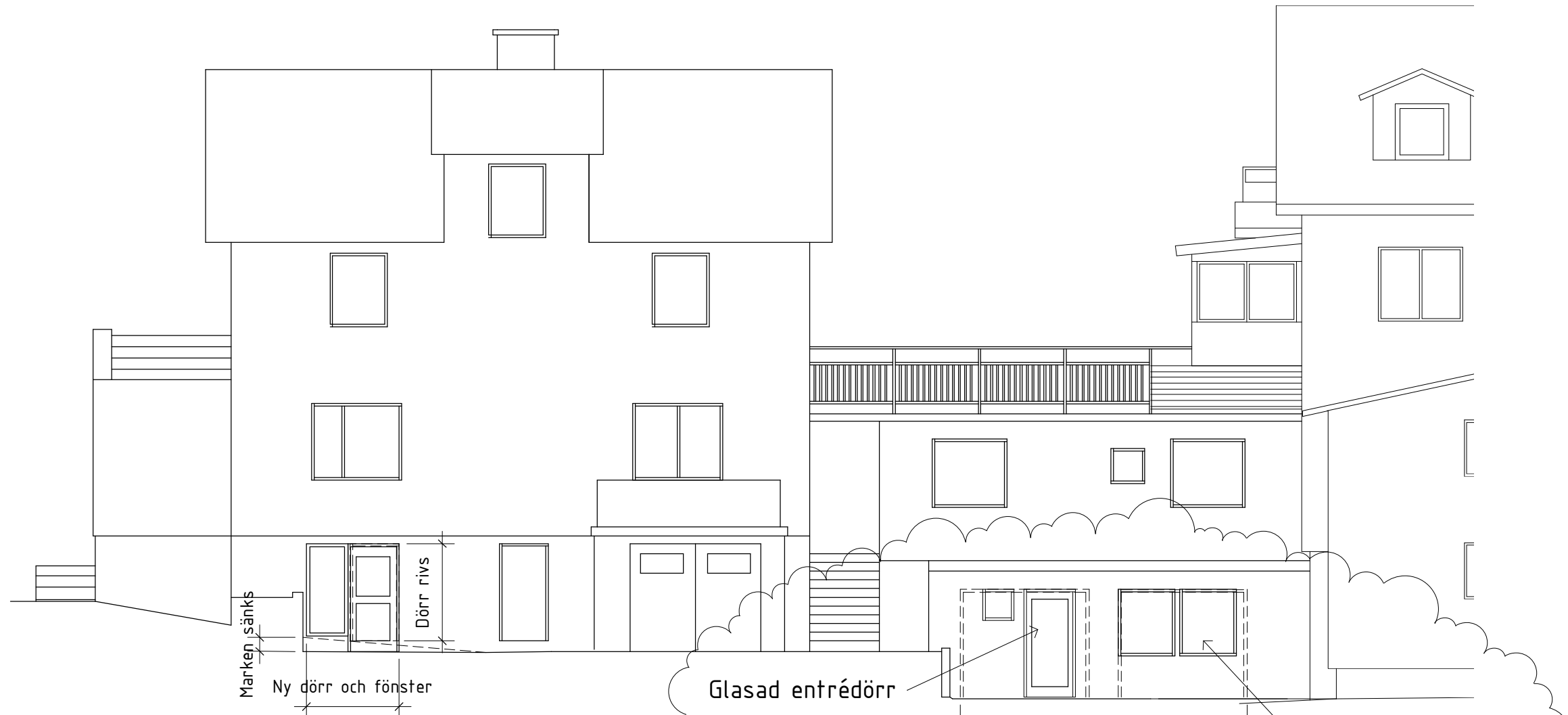
Fasad mot Sydost