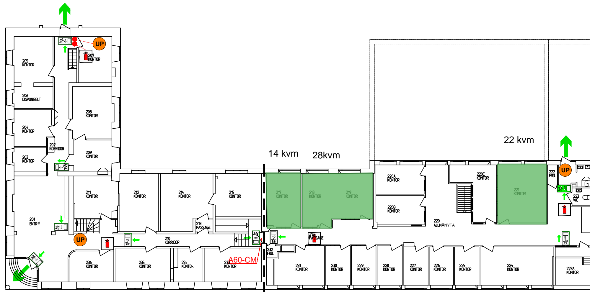
Plan1 hus A