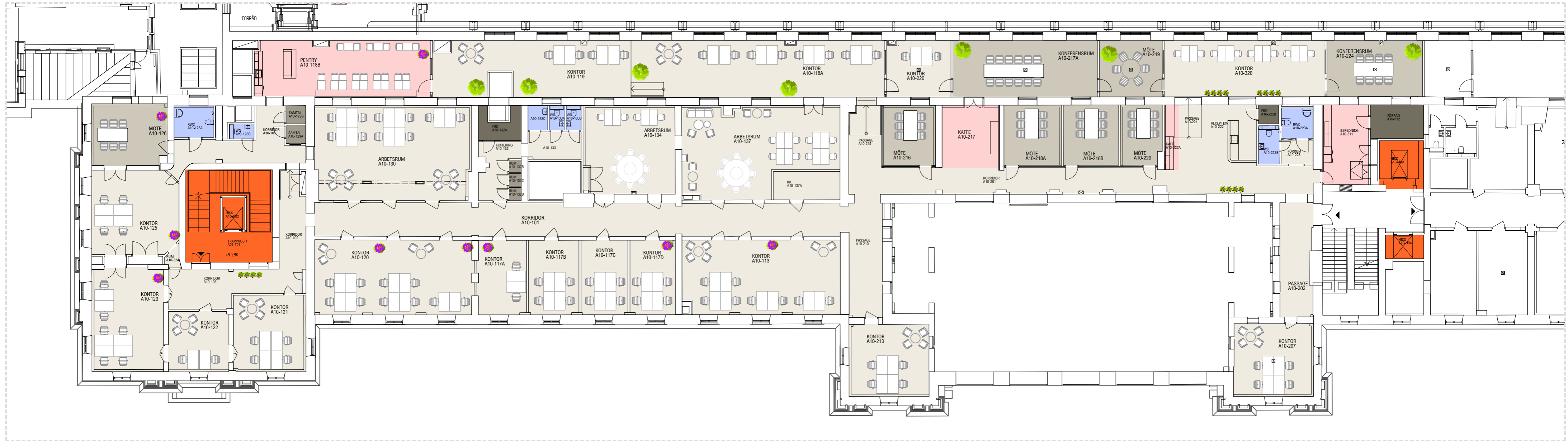
PLAN SKALA 1:200