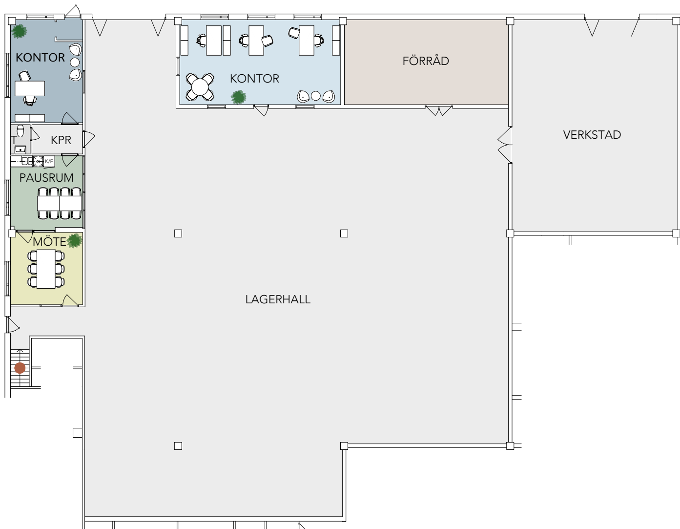
PLAN 1, BOTTENVÅNING