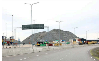
Det berg gav sten som blev kvar när hamnen byggdes har bromsat utvecklingen i området. Men nu ska stora mängder skeppas ut till Estland.