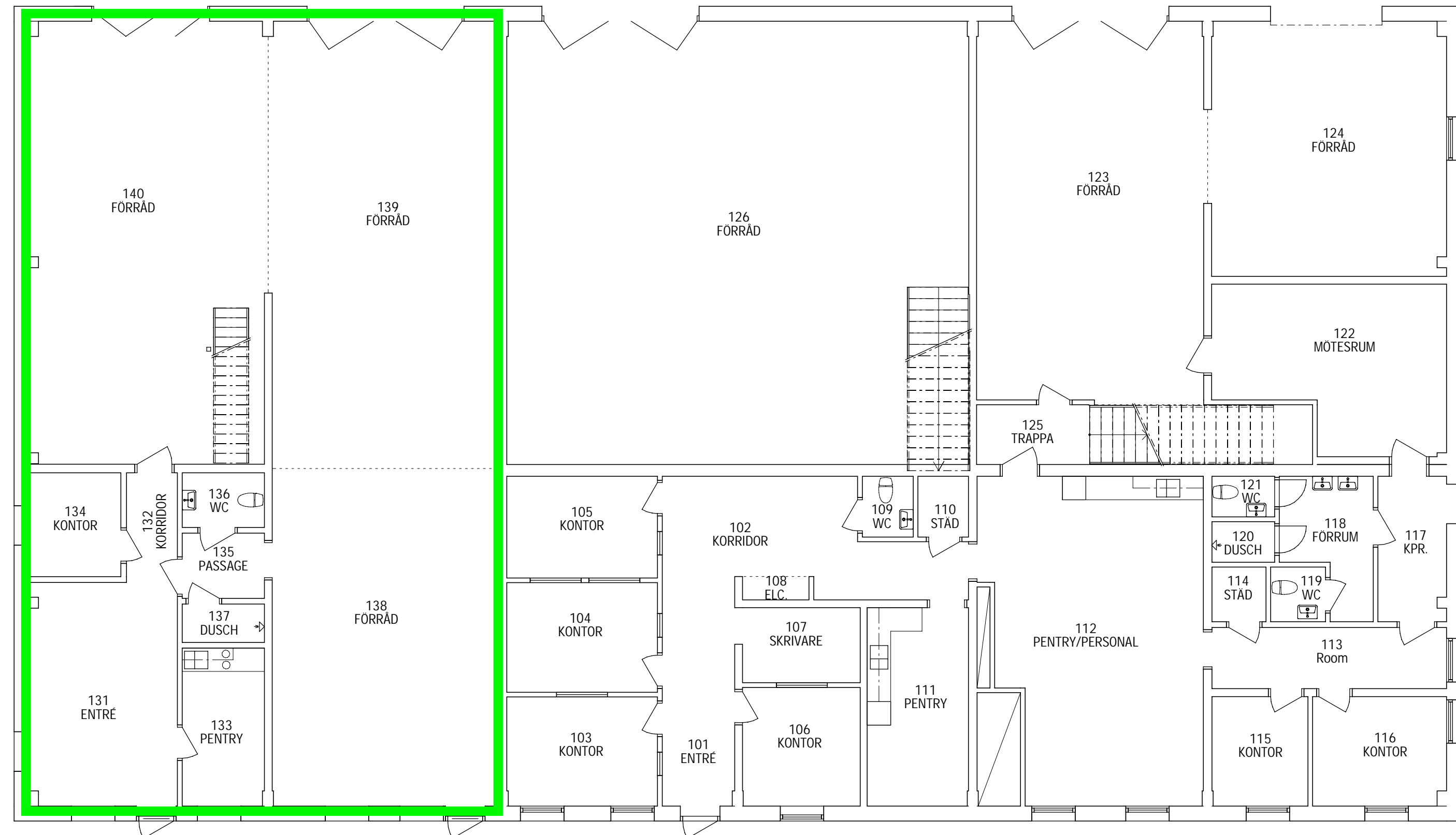
PLAN 1 1 : 100