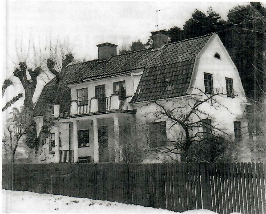
Den Lindhberg-ritade villan på Lagmansvägen. Lagg märke till den lätt svängda takkanten. För jämförelsens skull är det sedan lämpligt att ta sig till Tappgatan och se den andra villan.

Vid första världskrigets slut hade han förvärvat tomten nr 34 i roten Amerika,