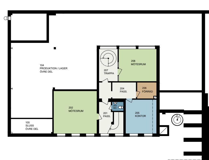
PLAN 3, VÅNING 1 TR