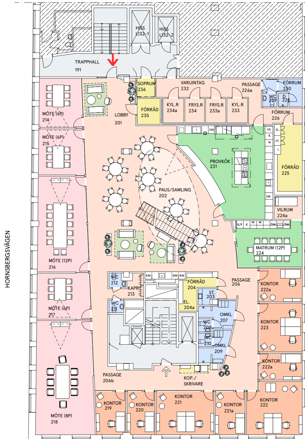
PLAN 3, 1 tr LINDHAGENSGATAN