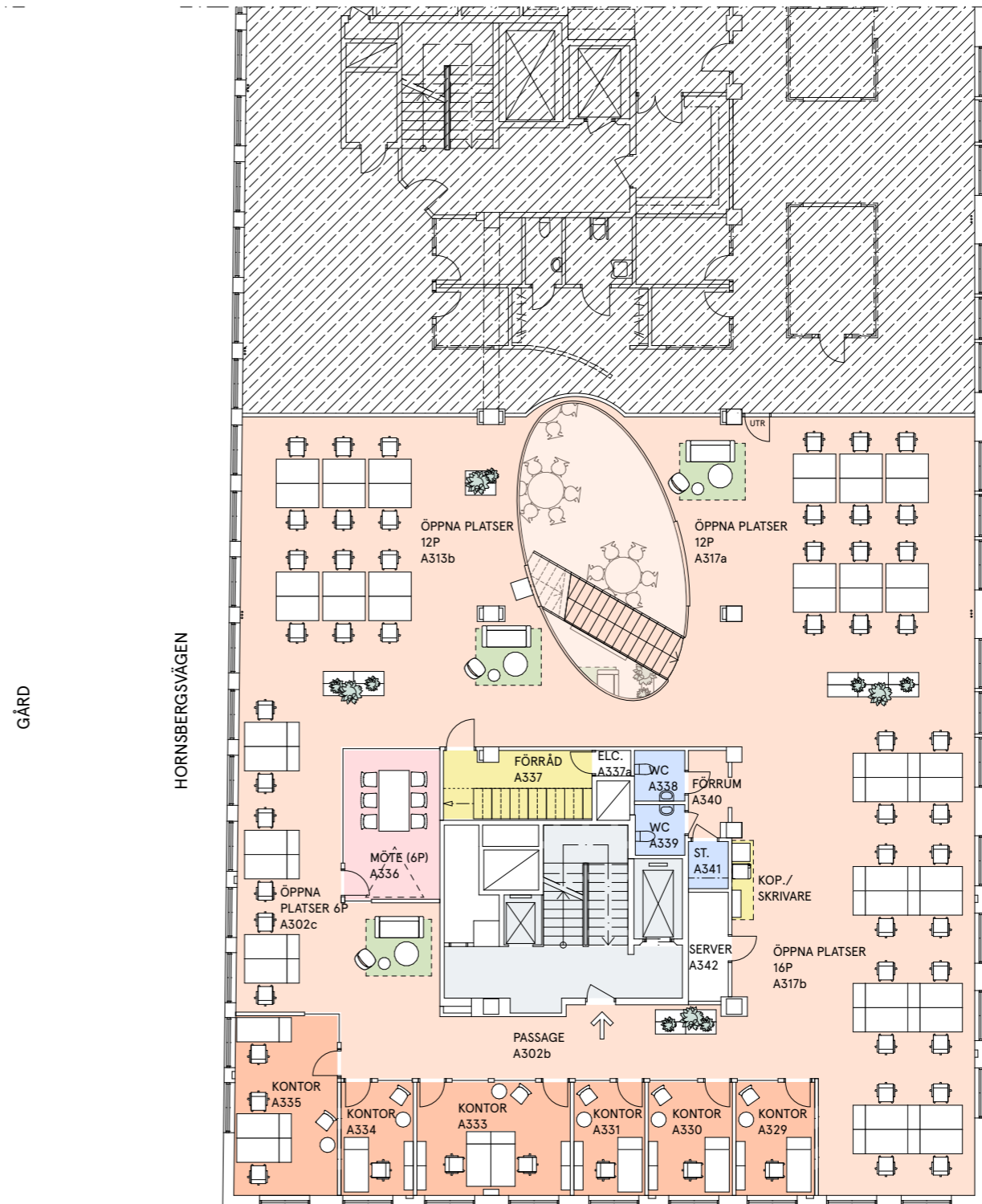
PLAN 4, 2 tr LINDHAGENSGATAN

Tot antal arbetsplatser: 66 st Antal öppna arbetsplatser: 46 st Antal arbetsplatser i rum 1-3p: 20 st Antal mötesrum 6-8p: 5 st Antal mötesrum 12p: 1 st