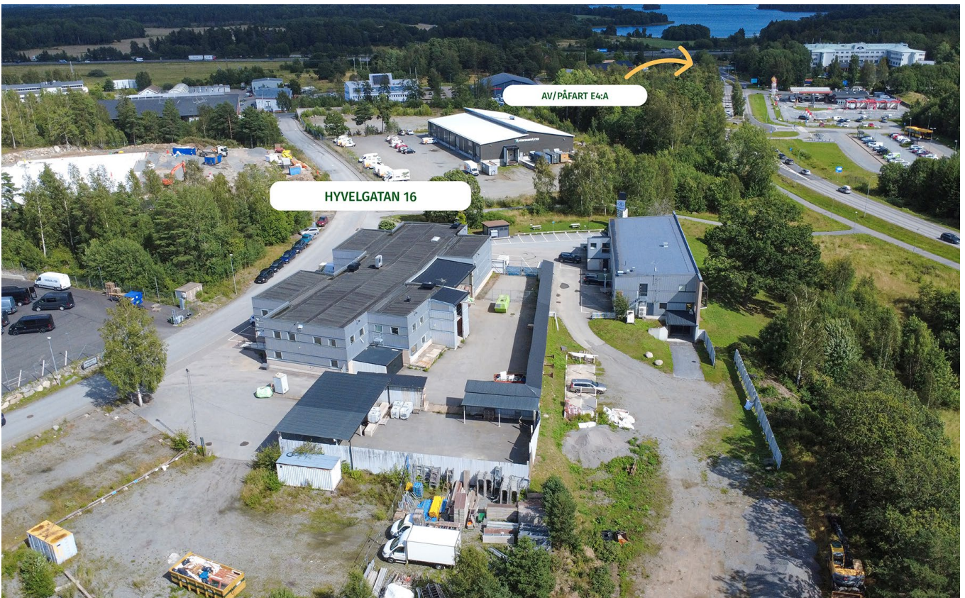
Gemensamt utrymme och fastighetens läge.