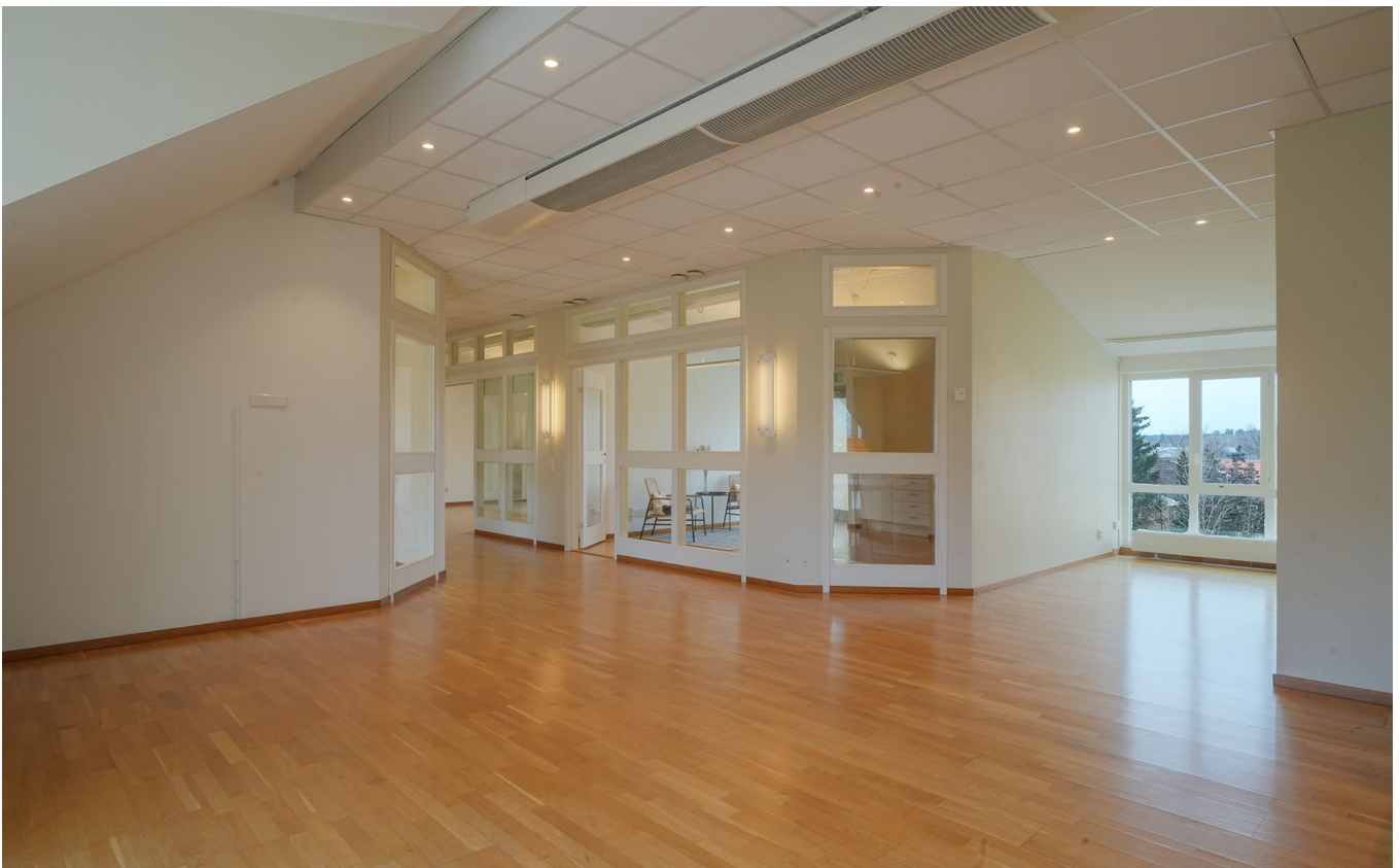
Kontorsrum, personalrum och kundentré