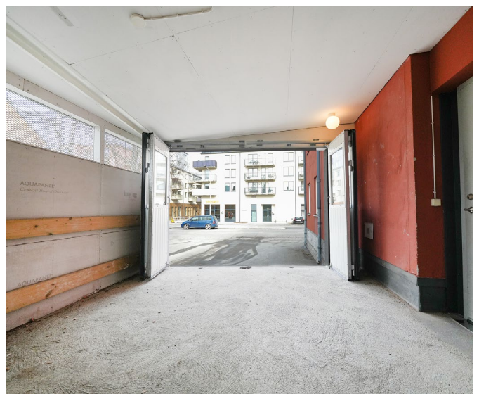
Lokalens mitteldel, sammanträdesrum och lastkaj.