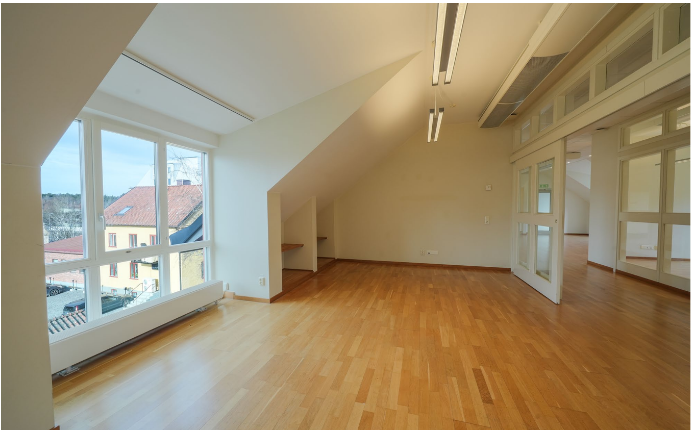
Kontorsrum med fönster åt öst och väst.