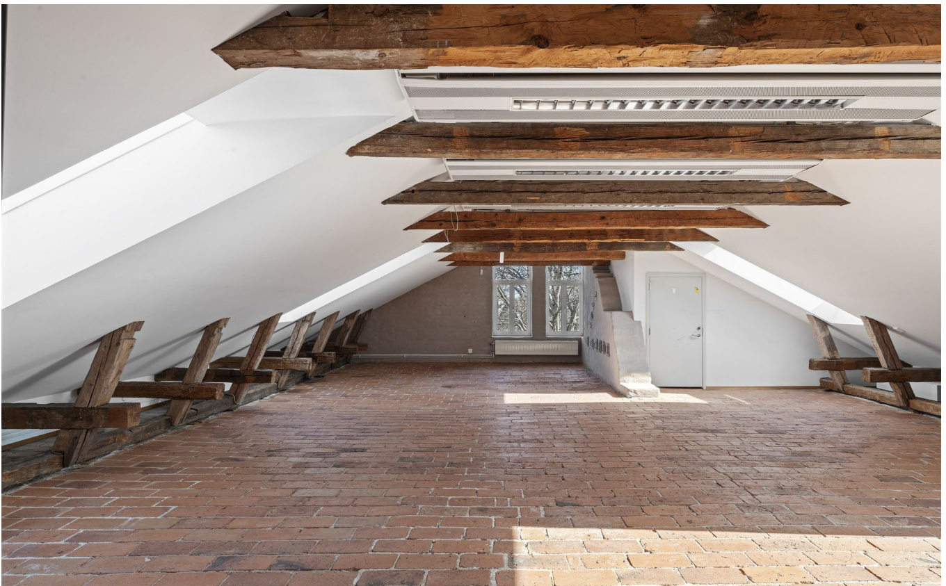
Utsikt och sammanträdesrum.