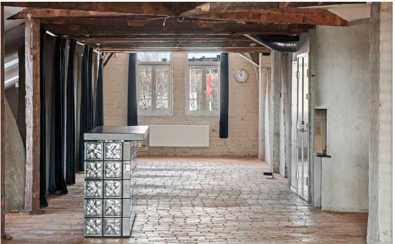
Kontorsrum, träbjälkar och utrymme för samvaro.