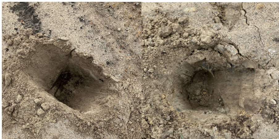
Bild 5 och 6. Ytliga gropar som har grävts för hand.

Avfallet som uppmärksammades vid tillsynsbesöken i juli 2023 är inte första gången som miljö- och stadsbyggnadsförvaltningen har sett avfall på fastigheten. I ärende med diarienummer 2018-169 har dåvarande miljökontoret noterat en vattenfylld grop på cirka 15 x 20 meter som delvis fyllt igen med bygg- och rivningsavfall. Dåvarande miljönämnden förelade er att avlägsna avfallet, transportera det till godkänd mottagningsanläggning och inkomma med redovisning på var det har lämnats. Ni har i ert yttrande informerat om att miljöavdelningen har varit på plats vid sorteringen av avfallet samt att vågsedlar har skickats in. Ni har dock inte skickat med varken vågsedlar eller någon annan dokumentation på att varken avfallet har sorterats ut och lämnats i väg och eller att miljöavdelningen varit på plats. Det finns inget heller inget registrerat i vårt system gällande vare sig besök eller redovisning. Det kan därmed antas att avfallet ligger kvar.