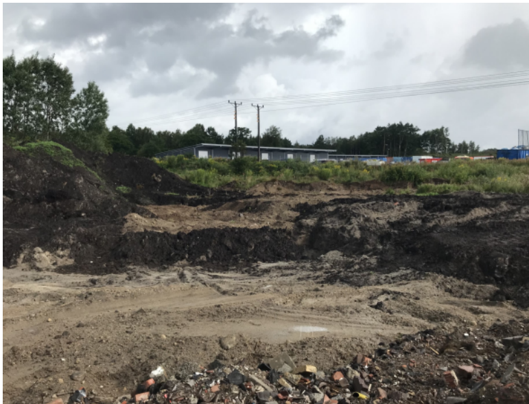
Bild 4. Bild från tillsynsbesök den 31 juli 2023.

Miljö- och stadsbyggnadsförvaltningen / Miljöavdelningen