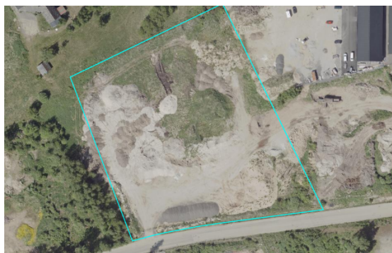
Bild 10. Ortofoto år 2021. Utfyllnad har fortsatt till norra delen av fastigheten.