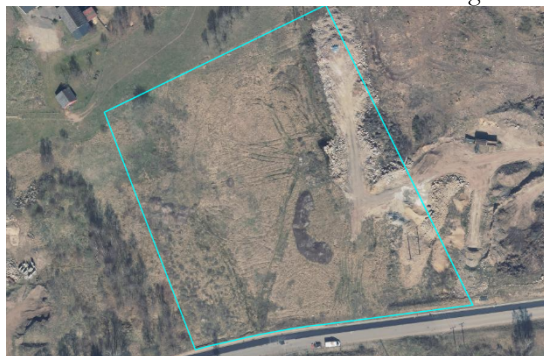
Bild 8. Ortofoto år 2019. Utfyllt i östra sidan av fastigheten.