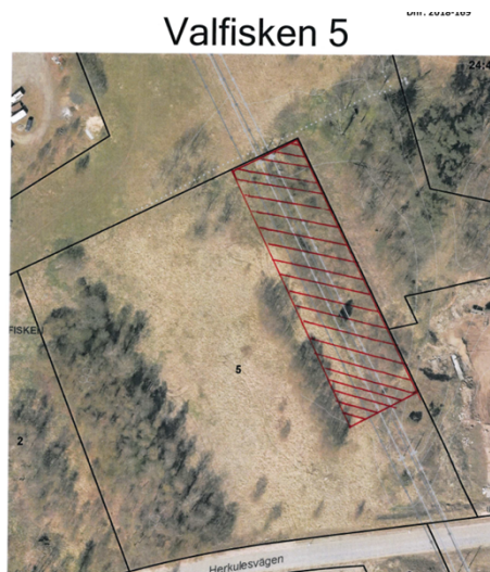
Bild 1. Rödmarkerat område på fastigheten Valfisken 5 där avfall ska avlägsnas och lämnas till godkänd mottagare.

Dåvarande miljönämnden förelade den 19 juni 2018 Skandinavisk Elkraft AB att avlägsna allt avfall inom rödmarkerat område och lämnas till godkänd mottagare. Mottagningskvitto eller annan motsvarande verifikation ska redovisas för miljökontoret. Ingen redovisning har skickats in.