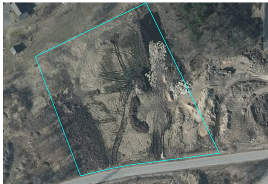
Bild 7. Ortofoto år 2018. Östra sidan av fastigheten håller på att fyllas ut.

ärende 2018-1066. Miljö- och stadsbyggnadsförvaltningen har inte fått in någon ytterligare anmälan om avfalls för anmälningsändamål.