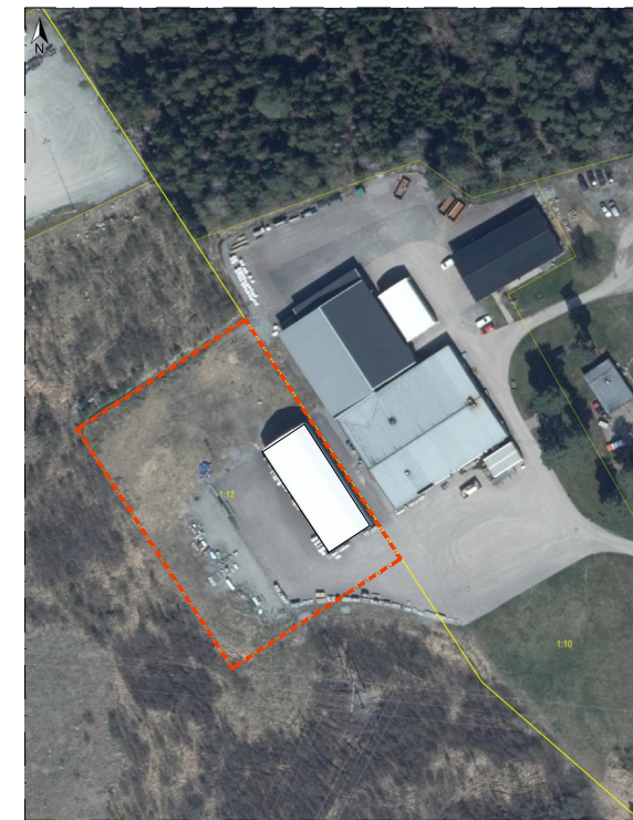
FLYGBILD (BEFINTLIGT UTFÖRANDE) ↑

FÖRKLARINGAR OCH FÖRESKRIFTER: MÅTT ANGES I MILLIMETER OM INTE ANNAT ANGES PLUSHÖJDER ANGES I METER.