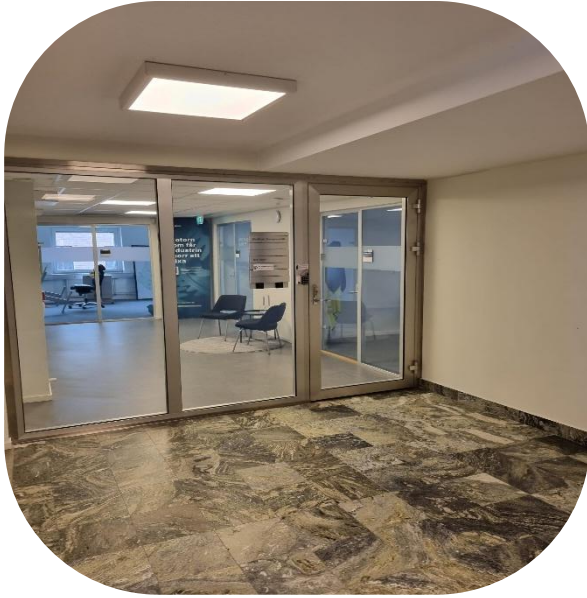
Entré med plats för sittgrupp