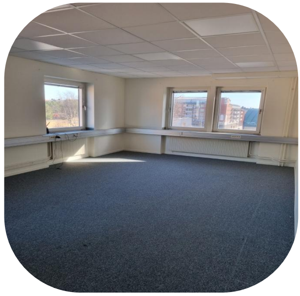
Större kontorsrum, utsikt Stadsparken/Rådstugatan