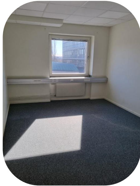
Mindre kontorsrum, utsikt Storgatan