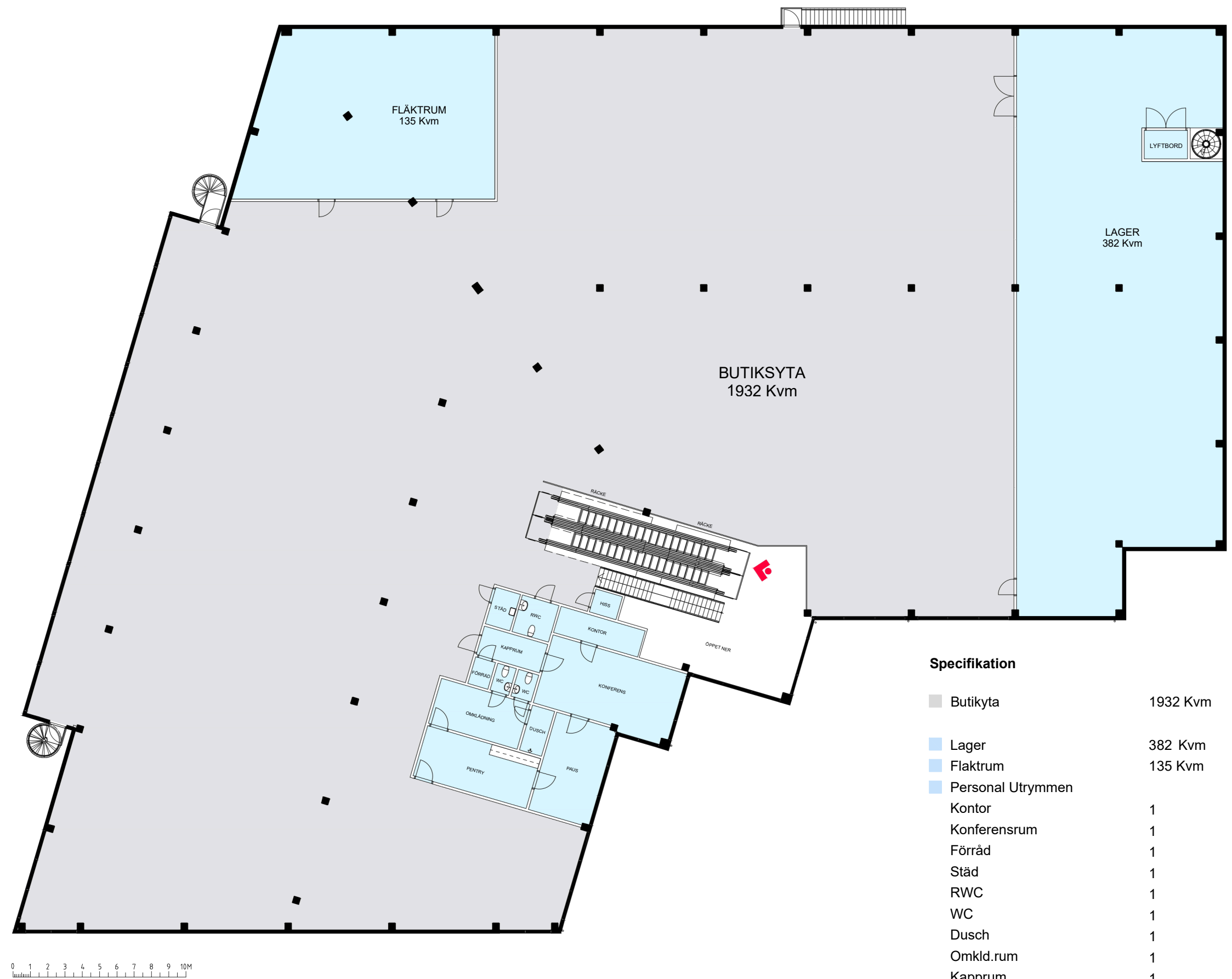
Plan 2 Totalyta - 2700 Kvm

Notering Planen är i befintligt skick och kan anpassas för hyresgästens behov.