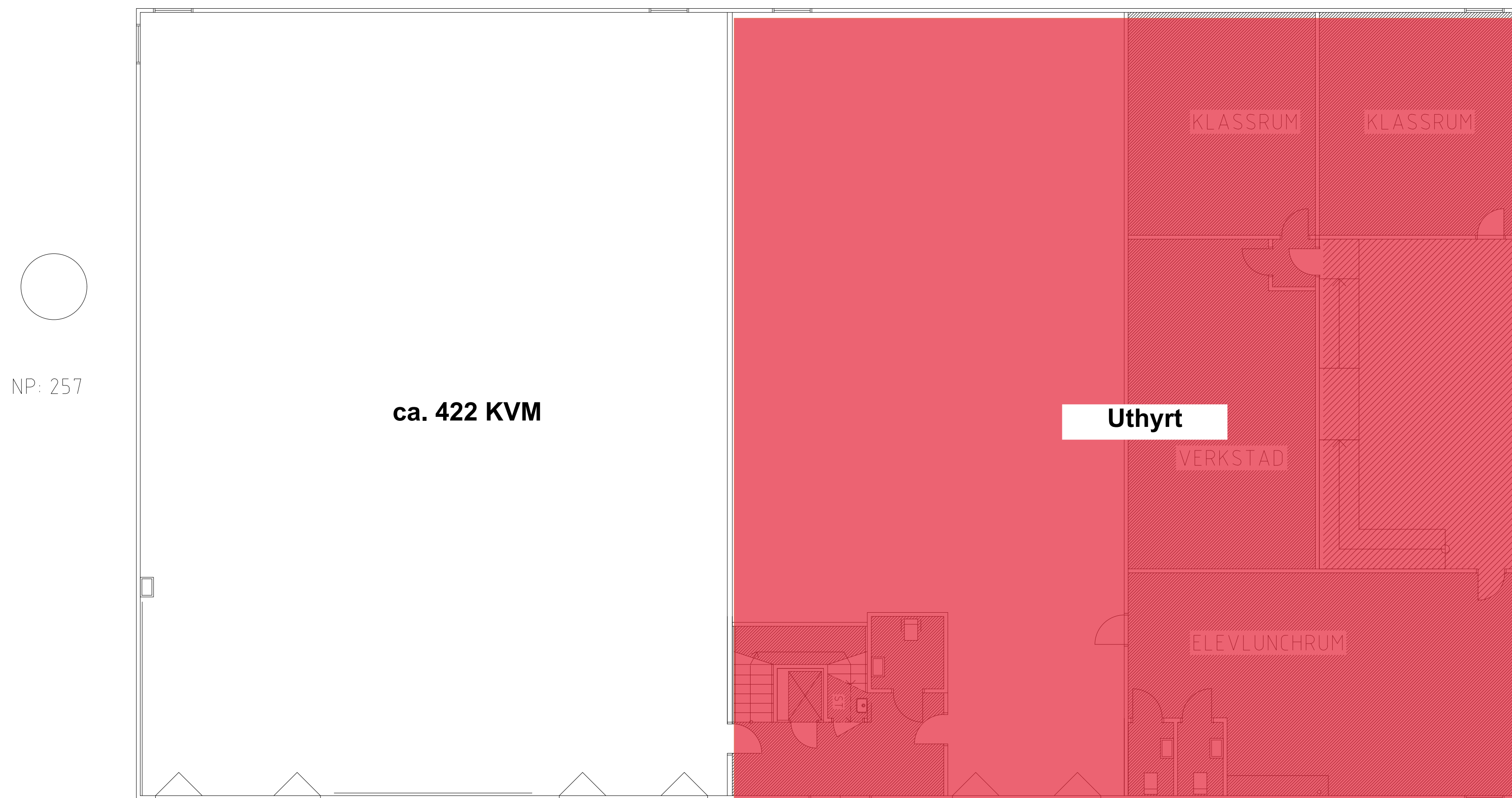
PLAN 1, ALT 2