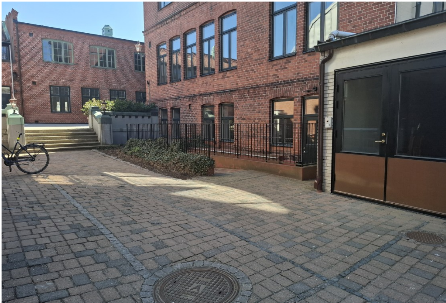
Entré till lokalen