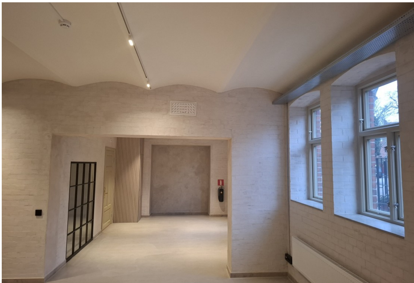
Entré från väster med ramp