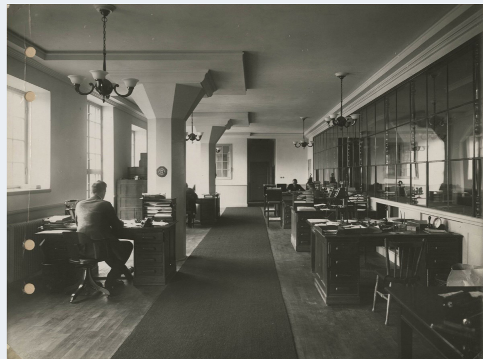
Moderna arbetsplatser i en historisk miljö