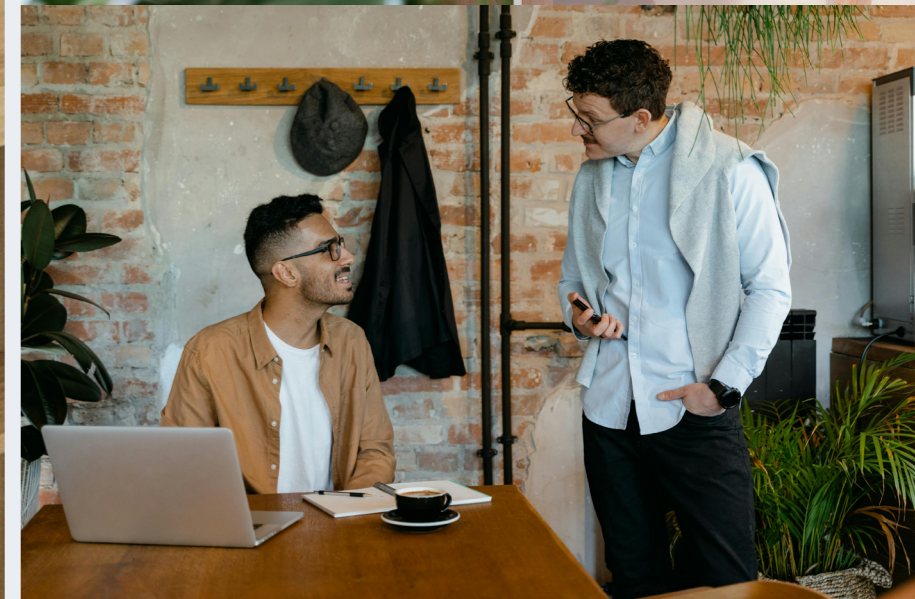
Kontorsytor med ateljékänsla och utsikt mot vattnet