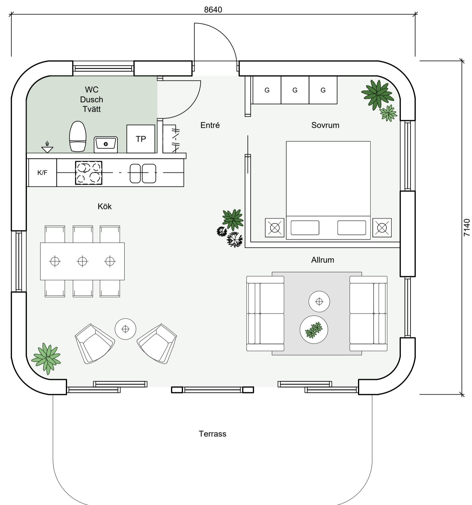
PLAN skala 1:50

Inga bilvägar kommer att anläggas till stugorna, endast gångstigar av grus. Parkering kommer att anordnas i anslutning till befintlig bilväg. I anslutning till parkeringen kommer upplag för avfallskärl att anordnas.