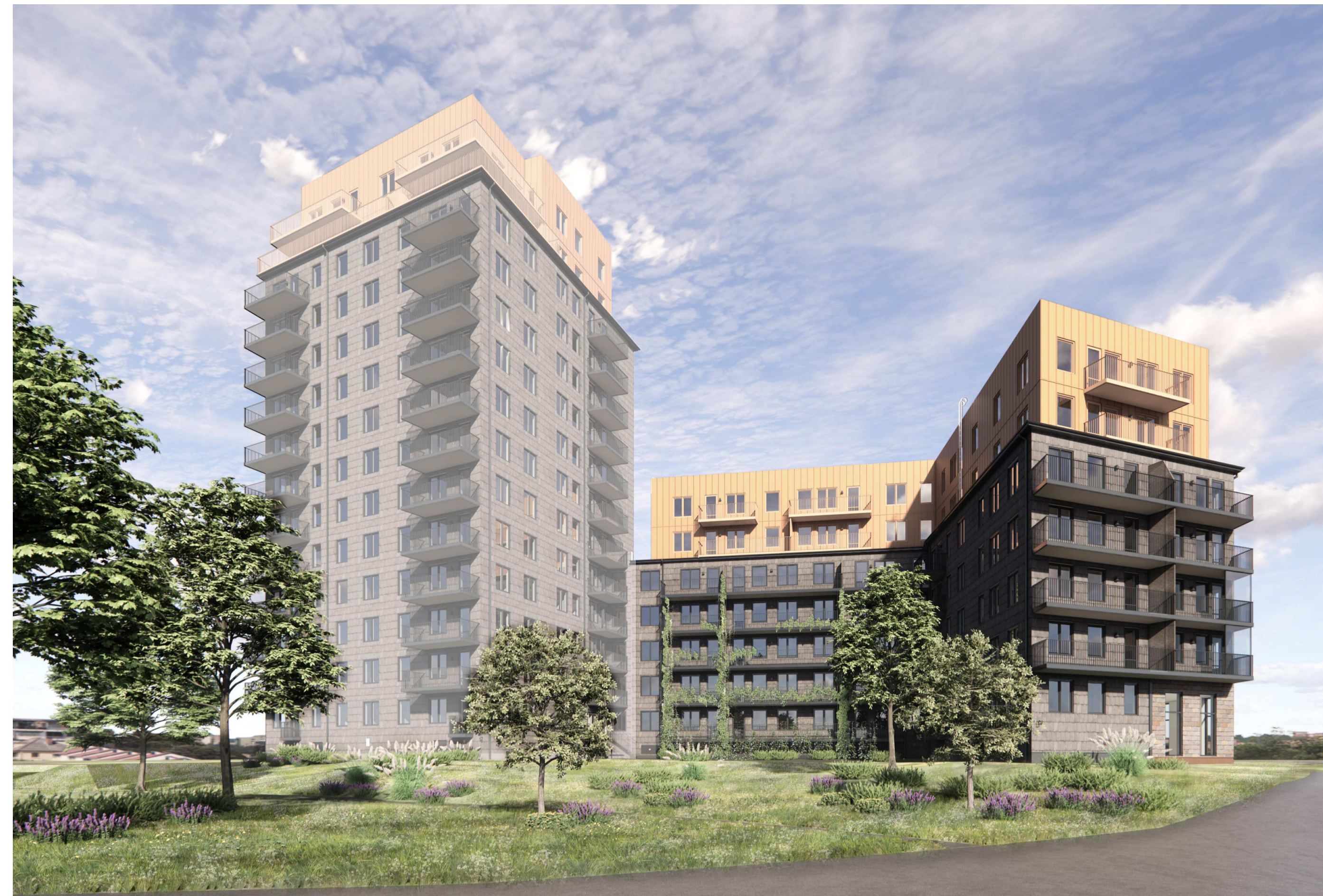
Vy 1, Perspektiv från park