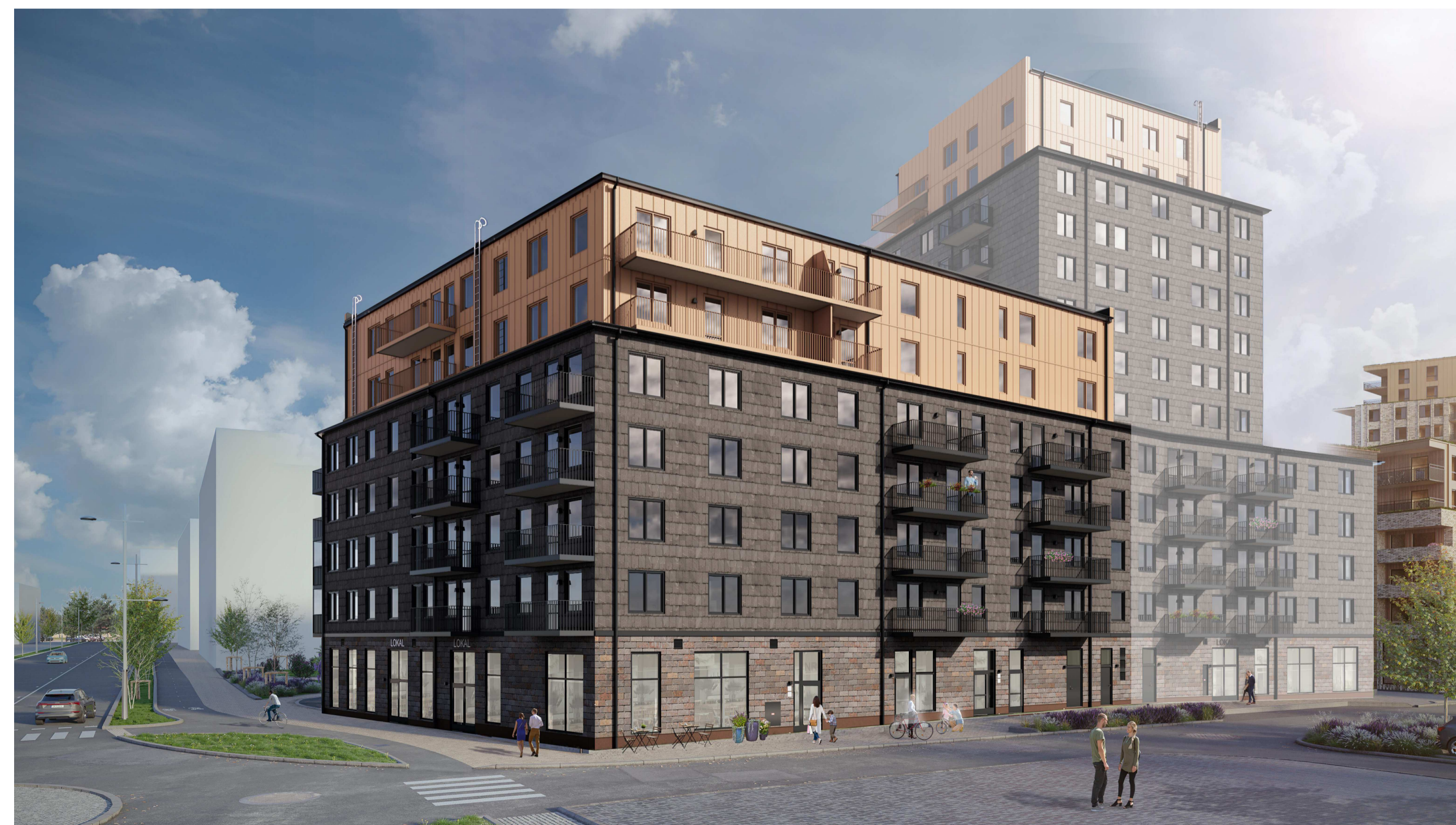
Vy 2, Perspektiv från gata