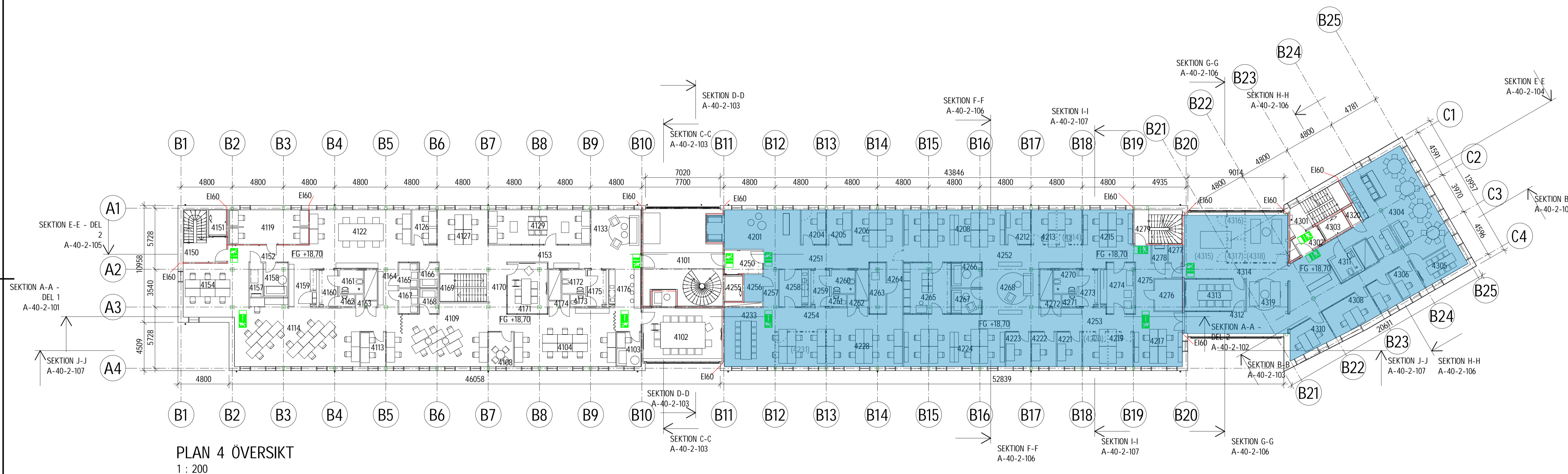
PLAN 4 ÖVERSIKT 1 : 200

PLAN 4 - DEL 11, MÄTTSÄTTN. O LITT. SE RITN. A-40-1-1411 PLAN 4 - DEL 12, MÄTTSÄTTN. O LITT. SE RITN. A-40-1-1412 PLAN 4 - DEL 21, MÄTTSÄTTN. O LITT. SE RITN. A-40-1-1421 PLAN 4 - DEL 22, MÄTTSÄTTN. O LITT. SE RITN. A-40-1-1422 PLAN 4 - DEL 31, MÄTTSÄTTN. O LITT. SE RITN. A-40-1-1431