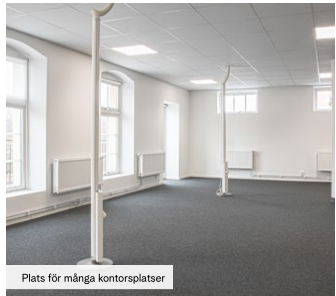
Plats för många kontorsplatser