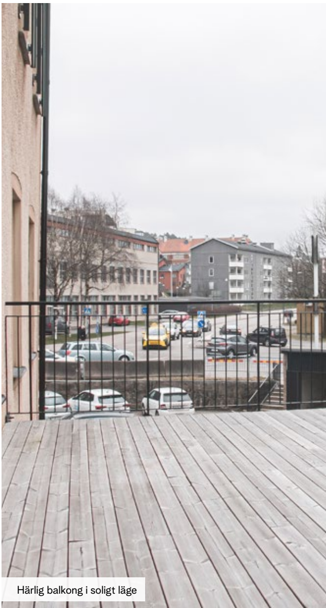
Härlig balkong i soligt läge