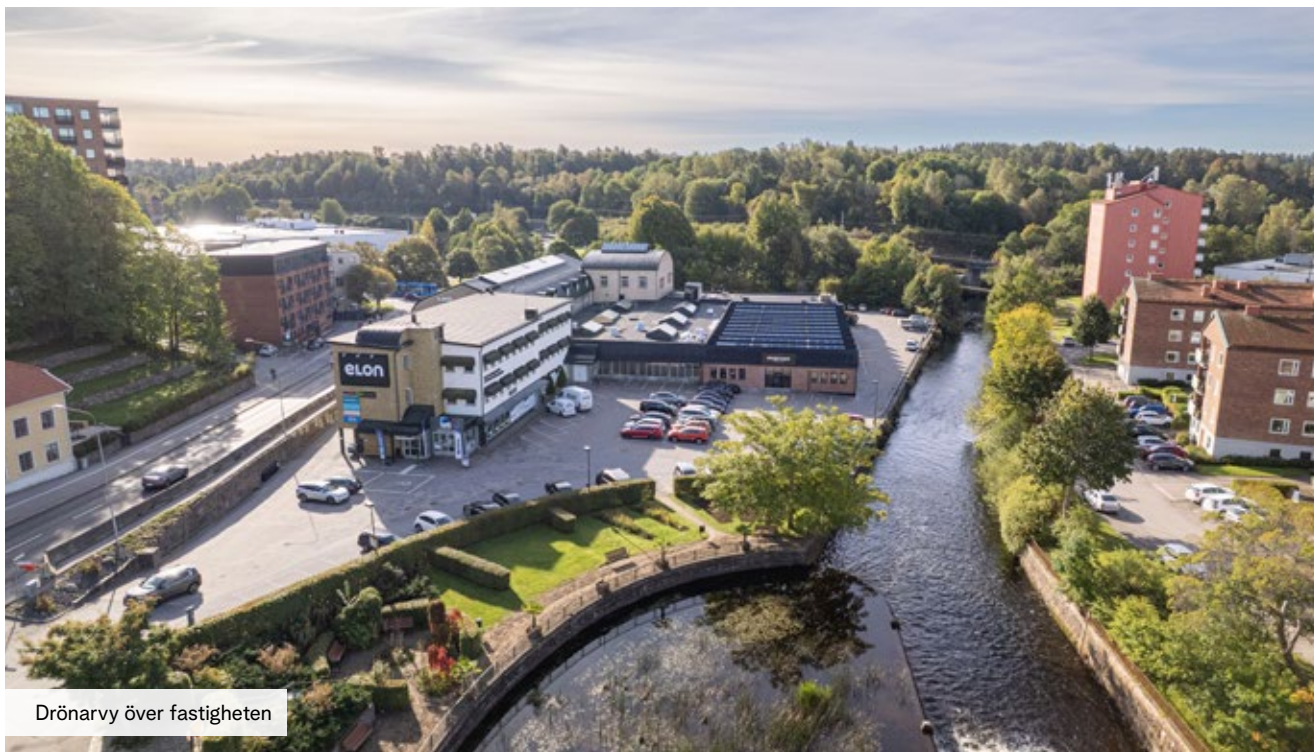
Drönarvy över fastigheten