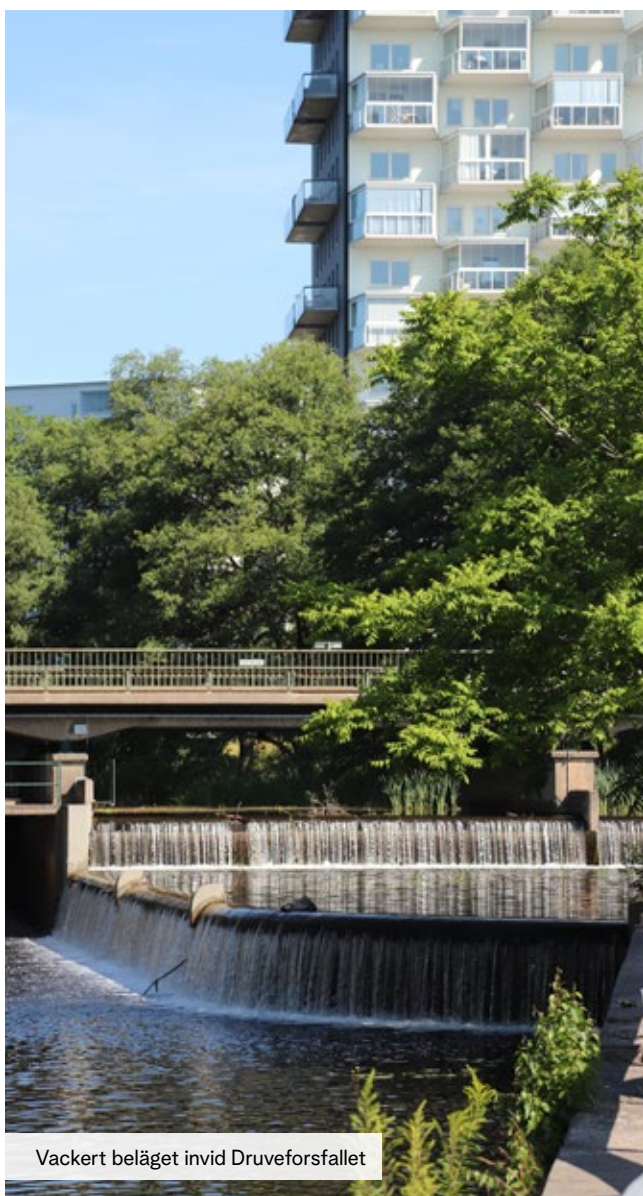
Vackert beläget invid Druveforsfallet