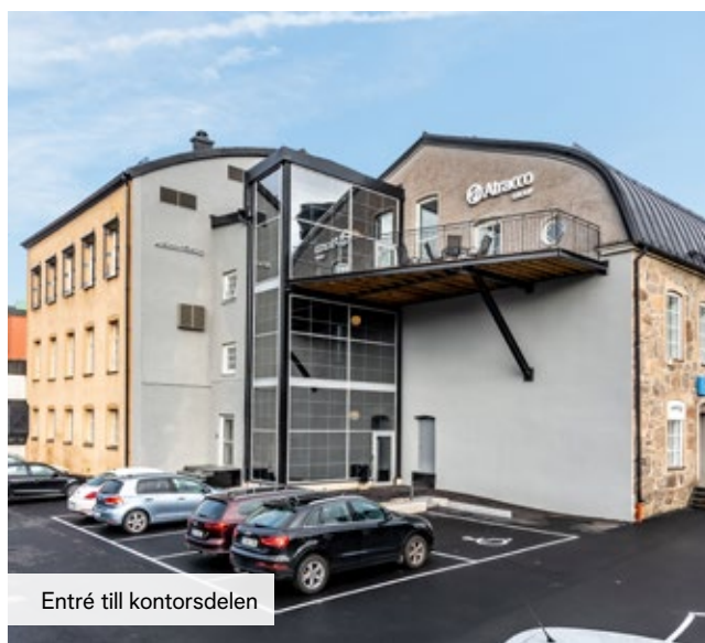
Entré till kontorsdelen