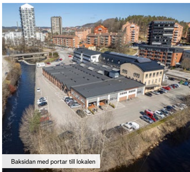
Baksidan med portar till lokalen