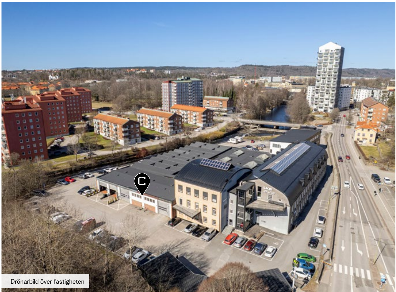
Drönbild över fastigheten