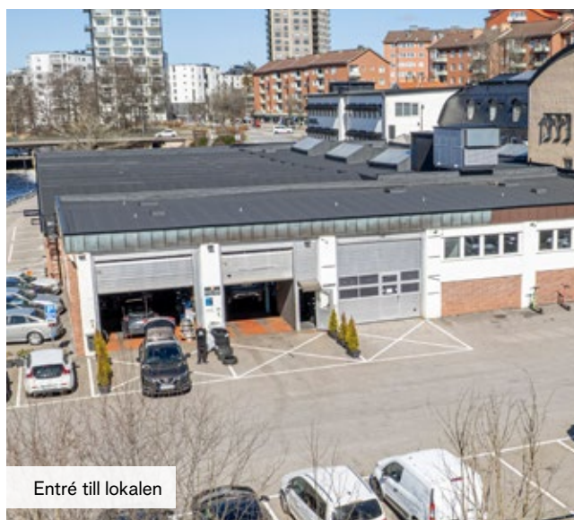
Entré till lokalen