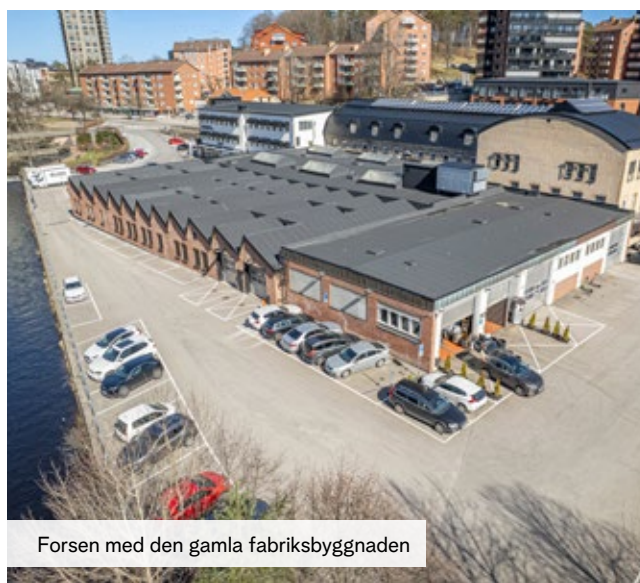
Forsen med den gamla fabriksbyggnaden