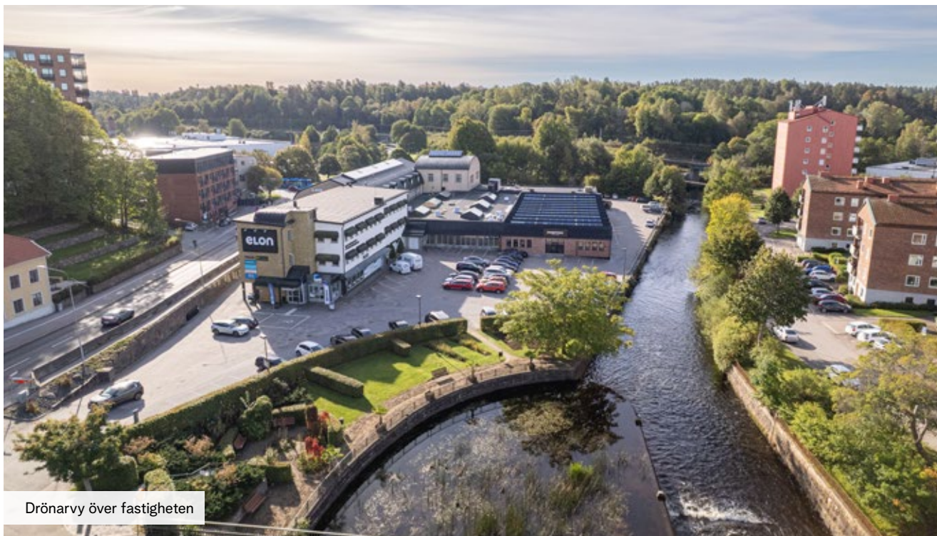
Drönarvy över fastigheten