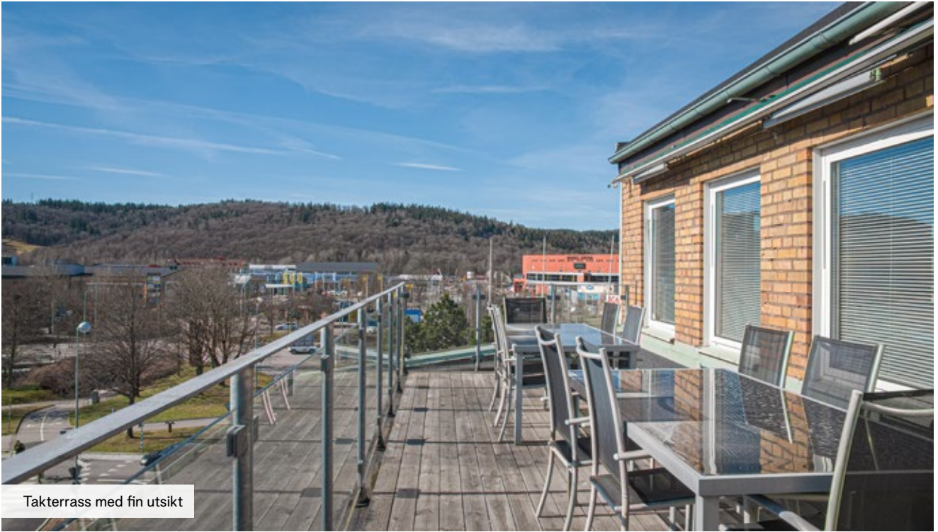
Takterrass med fin utsikt