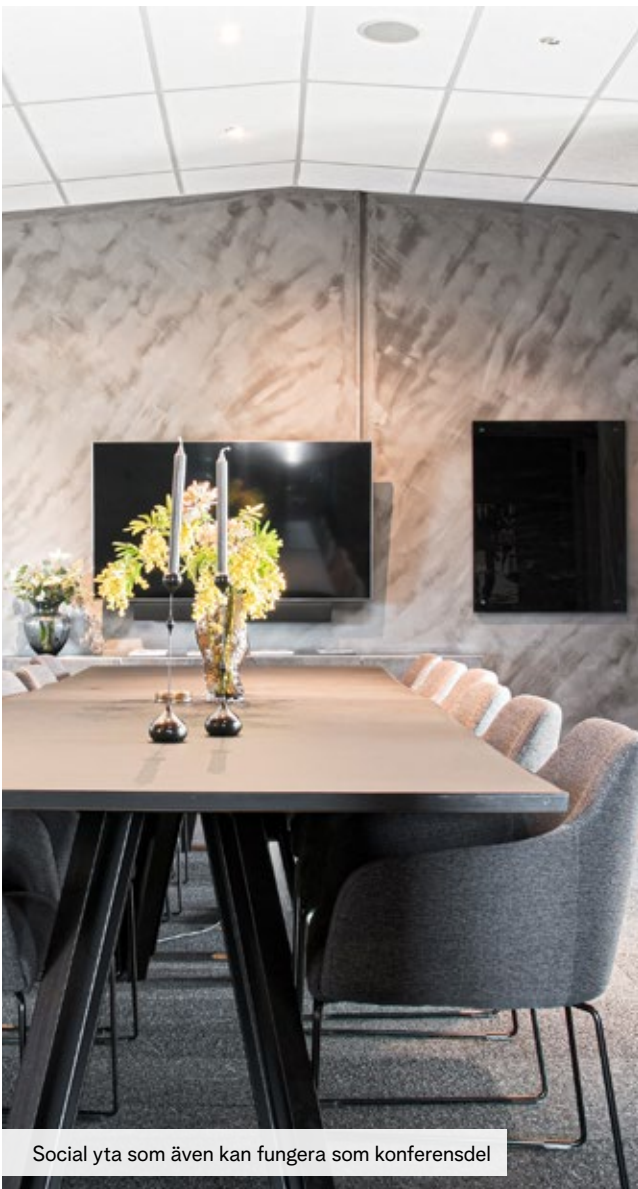
Social yta som även kan fungera som konferensdel