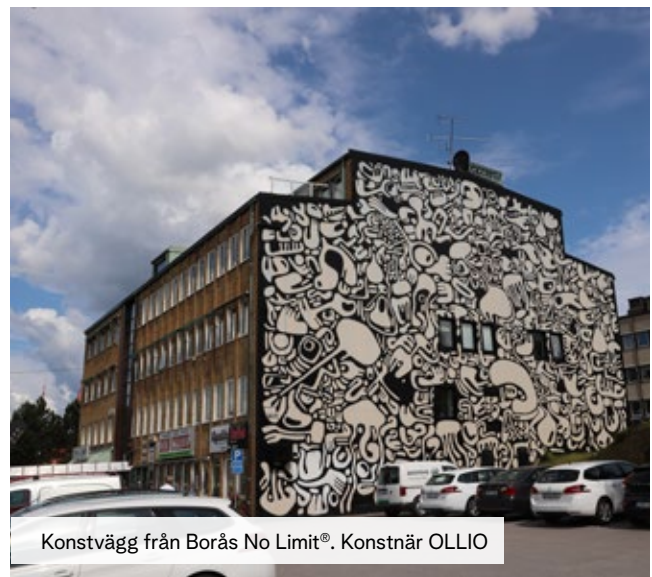
Konstvägg från Borås No Limit®. Konstnär OLLIO