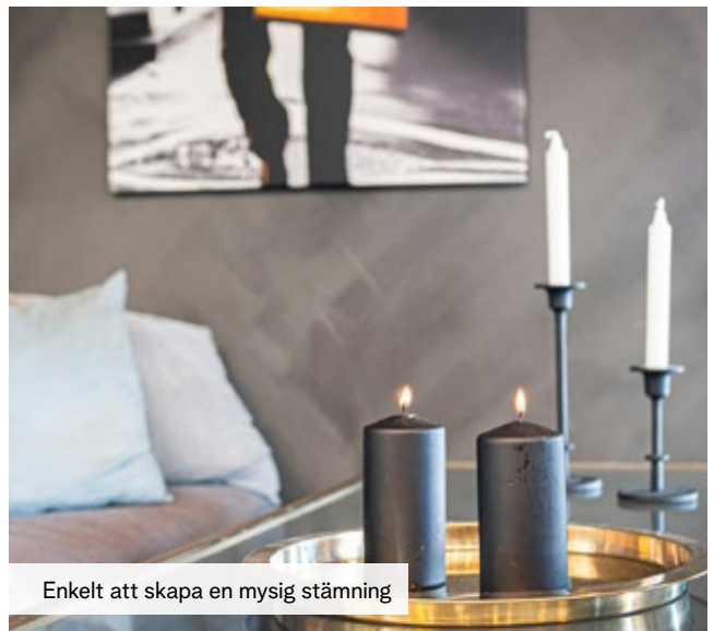
Enkelt att skapa en mysig stämning