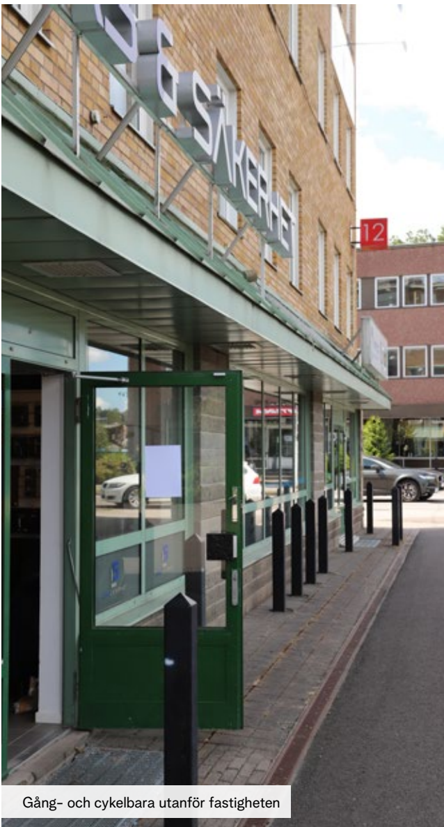
Gång- och cykelbara utanför fastigheten