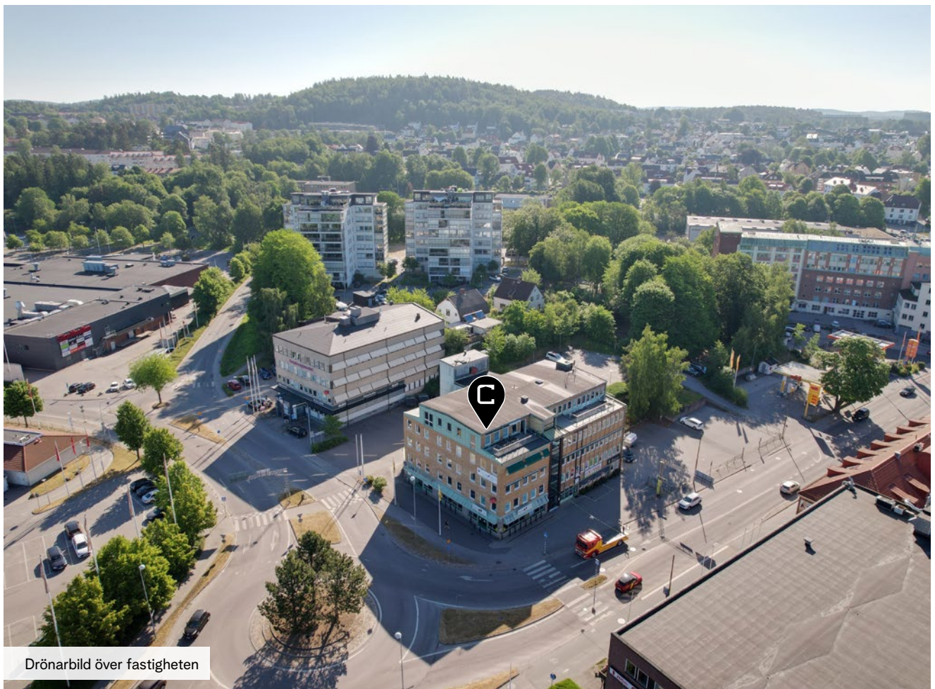
Drönbild över fastigheten