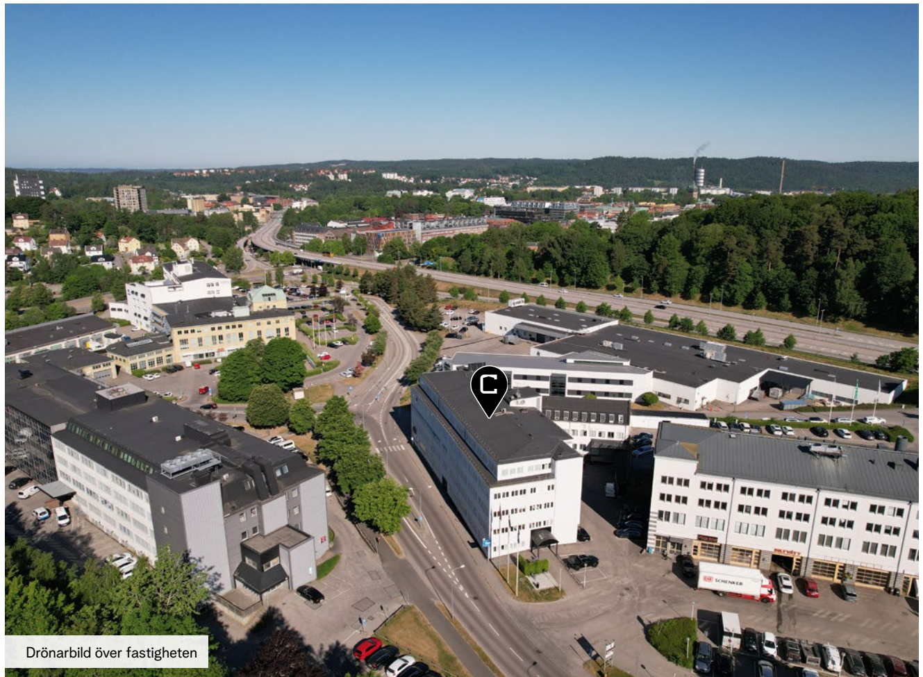
Drönbild över fastigheten