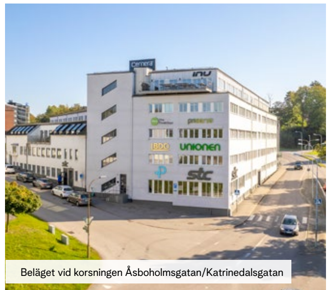
Beläget vid korsningen Åsboholmsgatan/Katrinédalsgatan