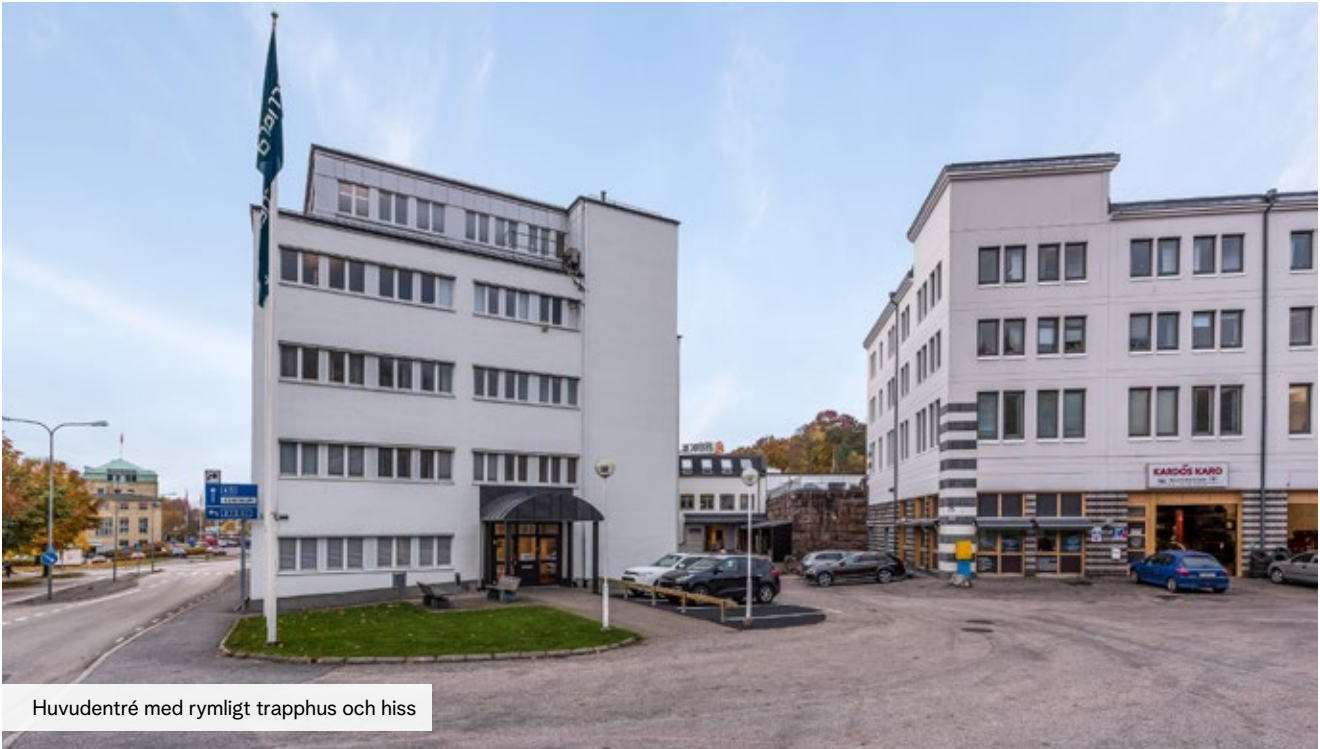
Huvudentré med rymligt trapphus och hiss