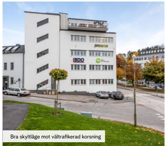
Bra skyltläge mot vältrafikerad korsning