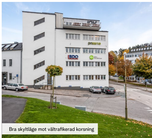
Bra skyltläge mot vältrafikerad korsning