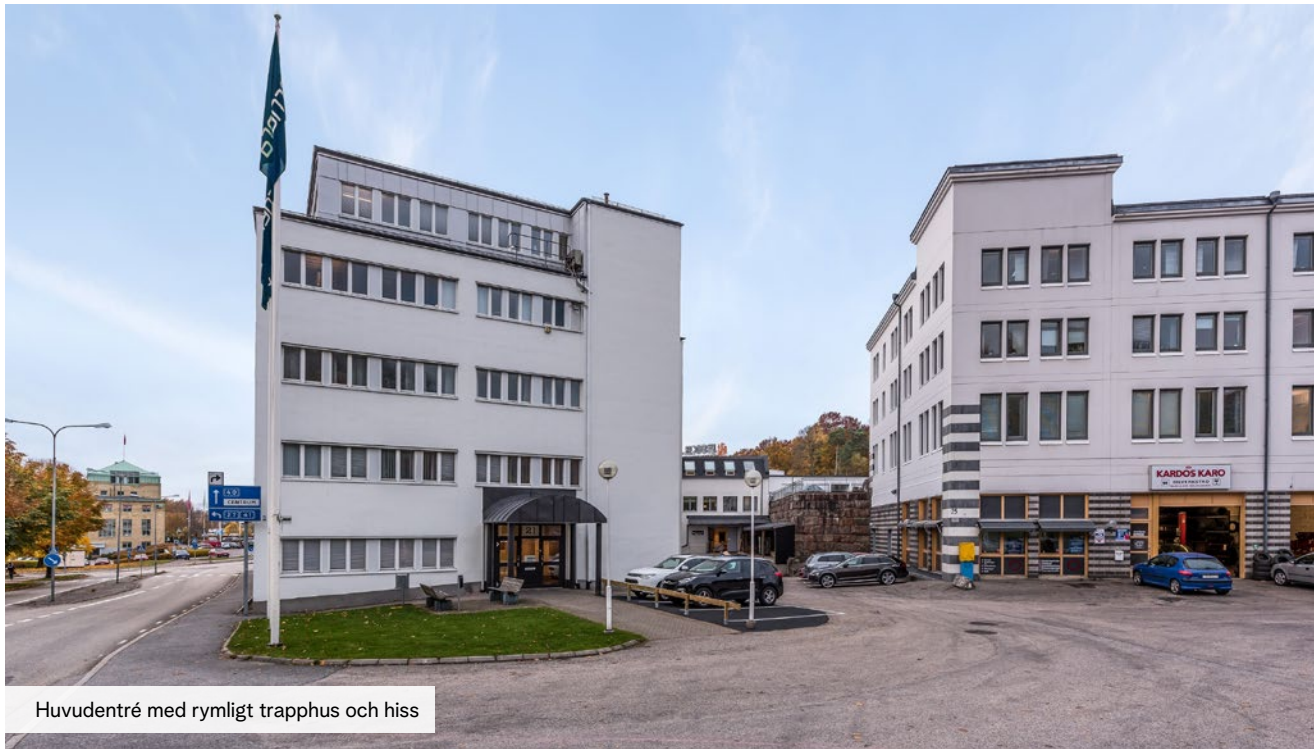
Huvudentré med rymligt trapphus och hiss