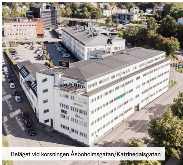
Beläget vid korsningen Åsboholmmsgatan/Katrinedalsgatan