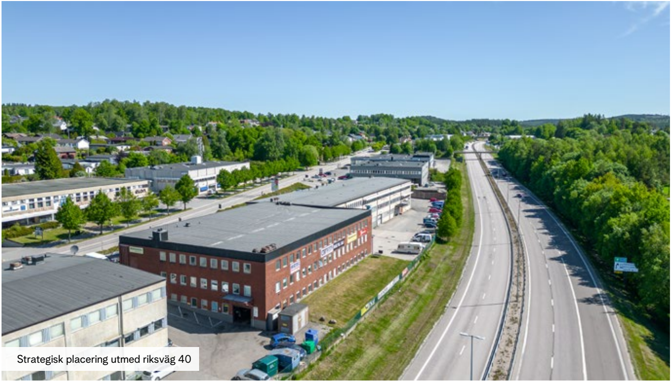
Strategisk placering utmed riksväg 40