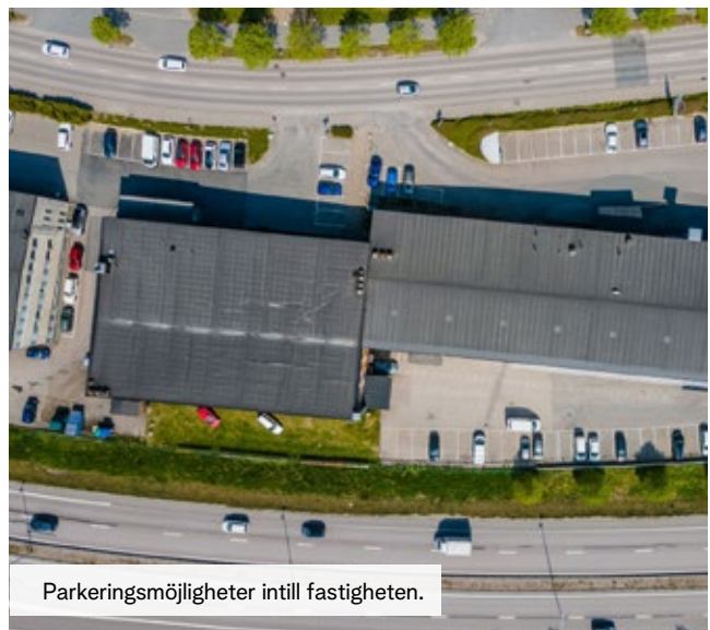
Parkeringsmöjligheter intill fastigheten.