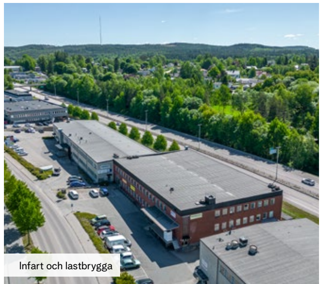
Infart och lastbrygga