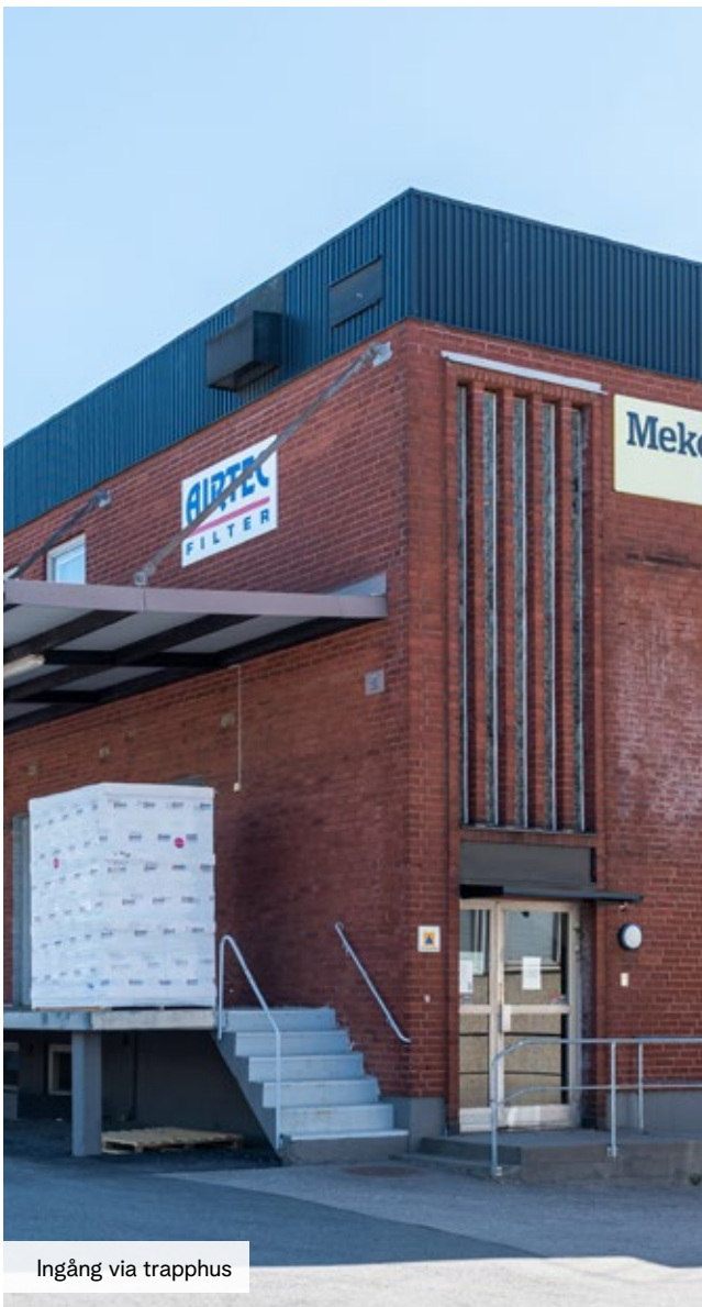
Ingång via trapphus