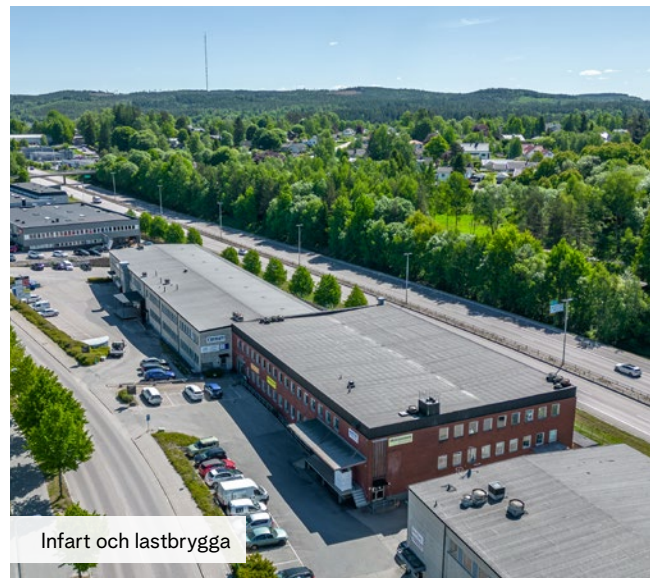
Infart och lastbrygga