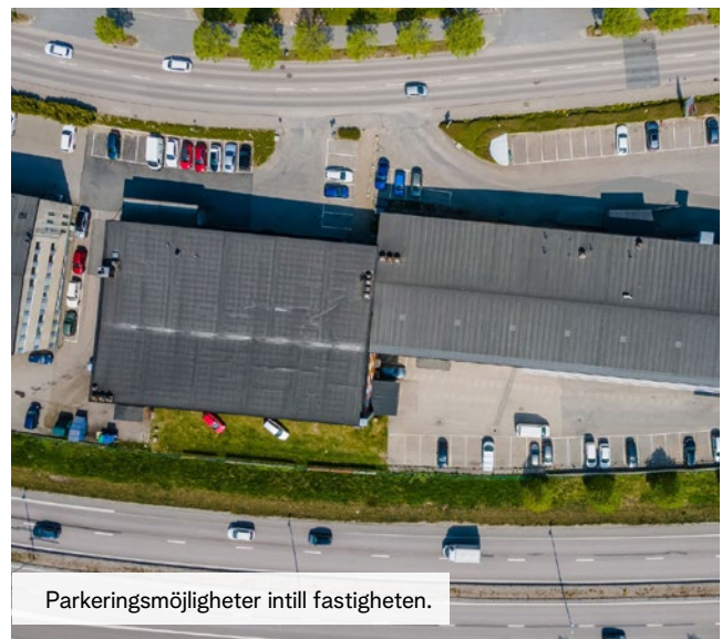
Parkeringsmöjligheter intill fastigheten.