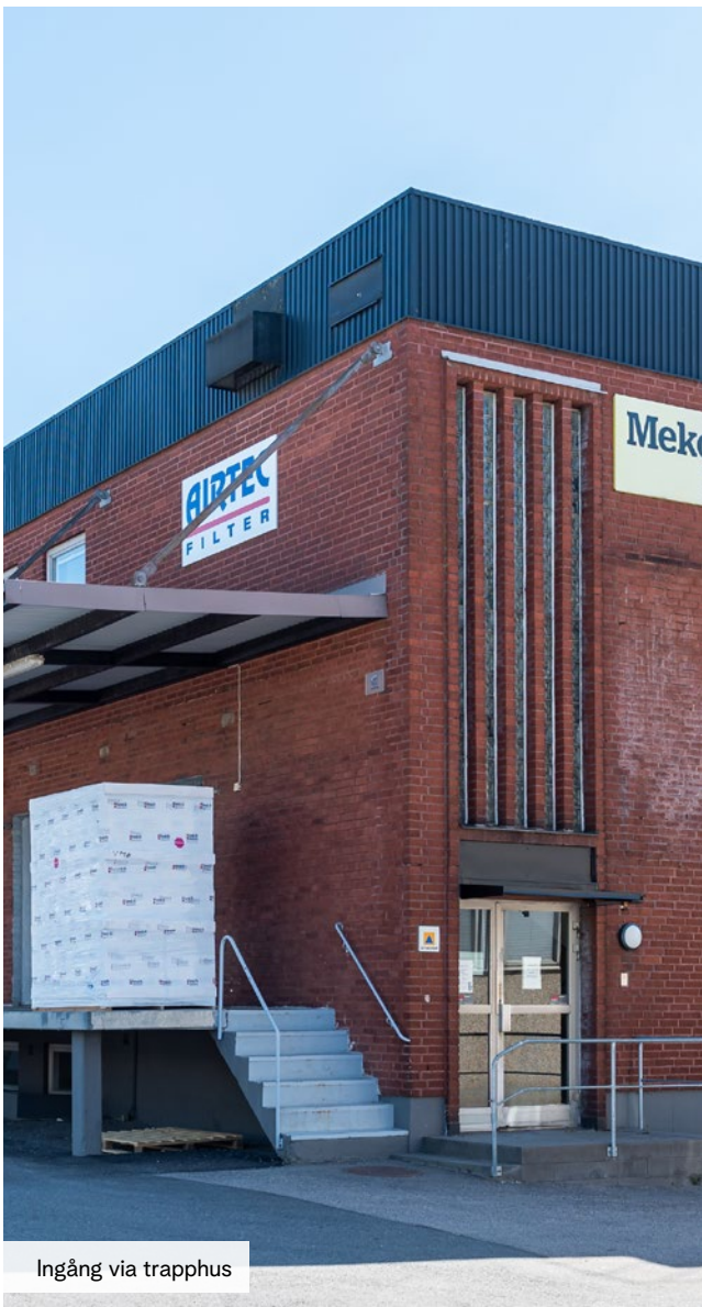
Ingång via trapphus