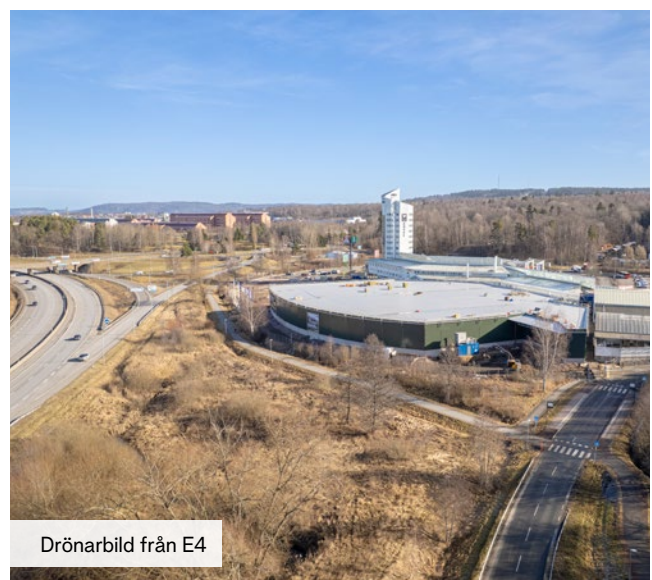
Drönbild från E4