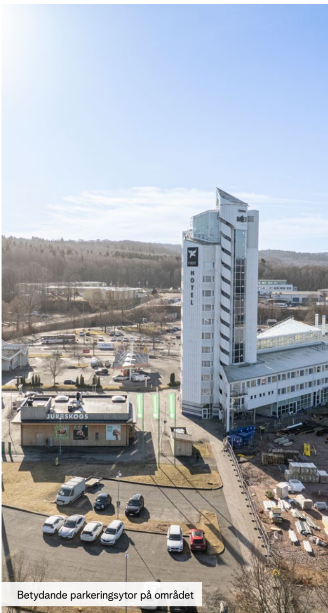
Betydande parkeringsytor på området