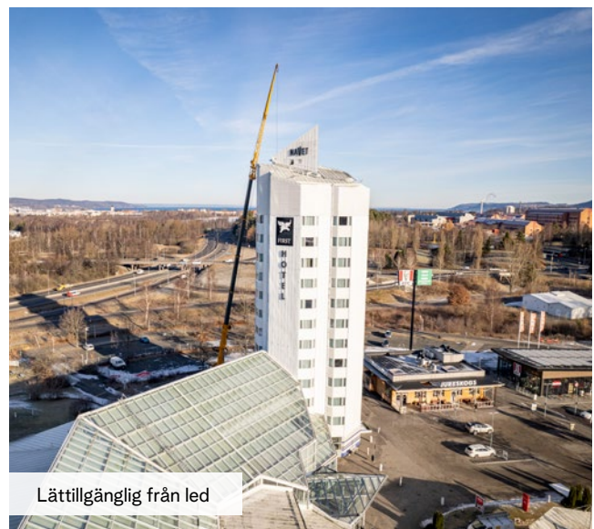
Lättillgänglig från led