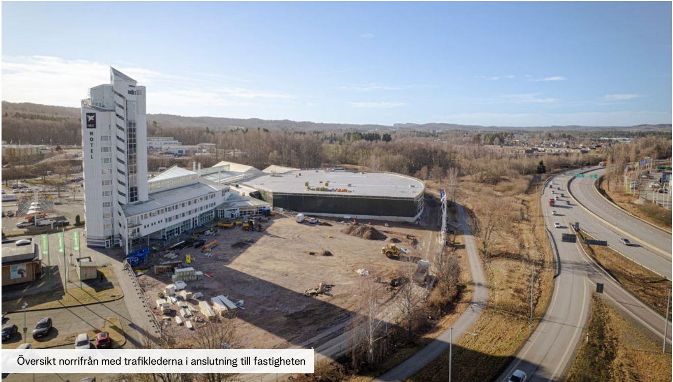
Översikt norrifrån med trafiklederna i anslutning till fastigheten