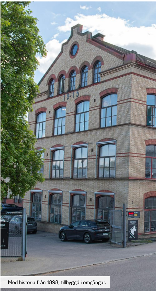
Med historia från 1898, tillbyggt i omgångar.