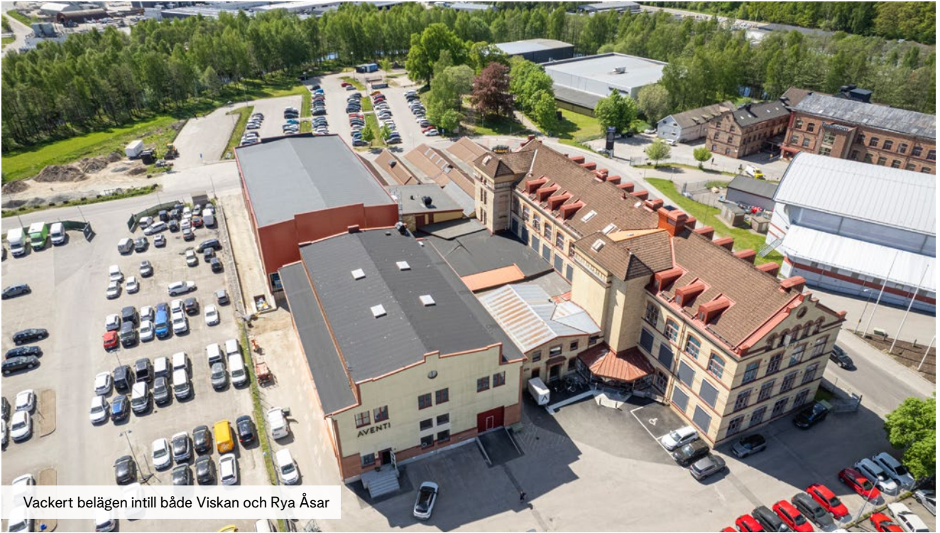
Vackert belägen intill både Viskan och Rya Åsar