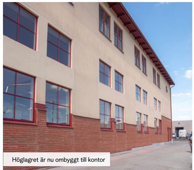
Höglagret är nu ombyggt till kontor