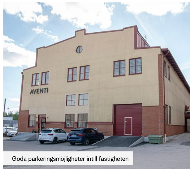
Goda parkeringsmöjligheter intill fastigheten