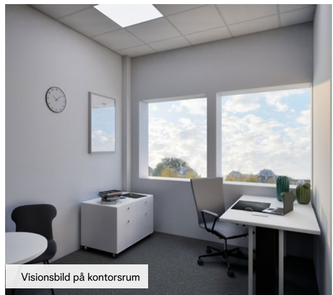
Visionsbild på kontorsrum