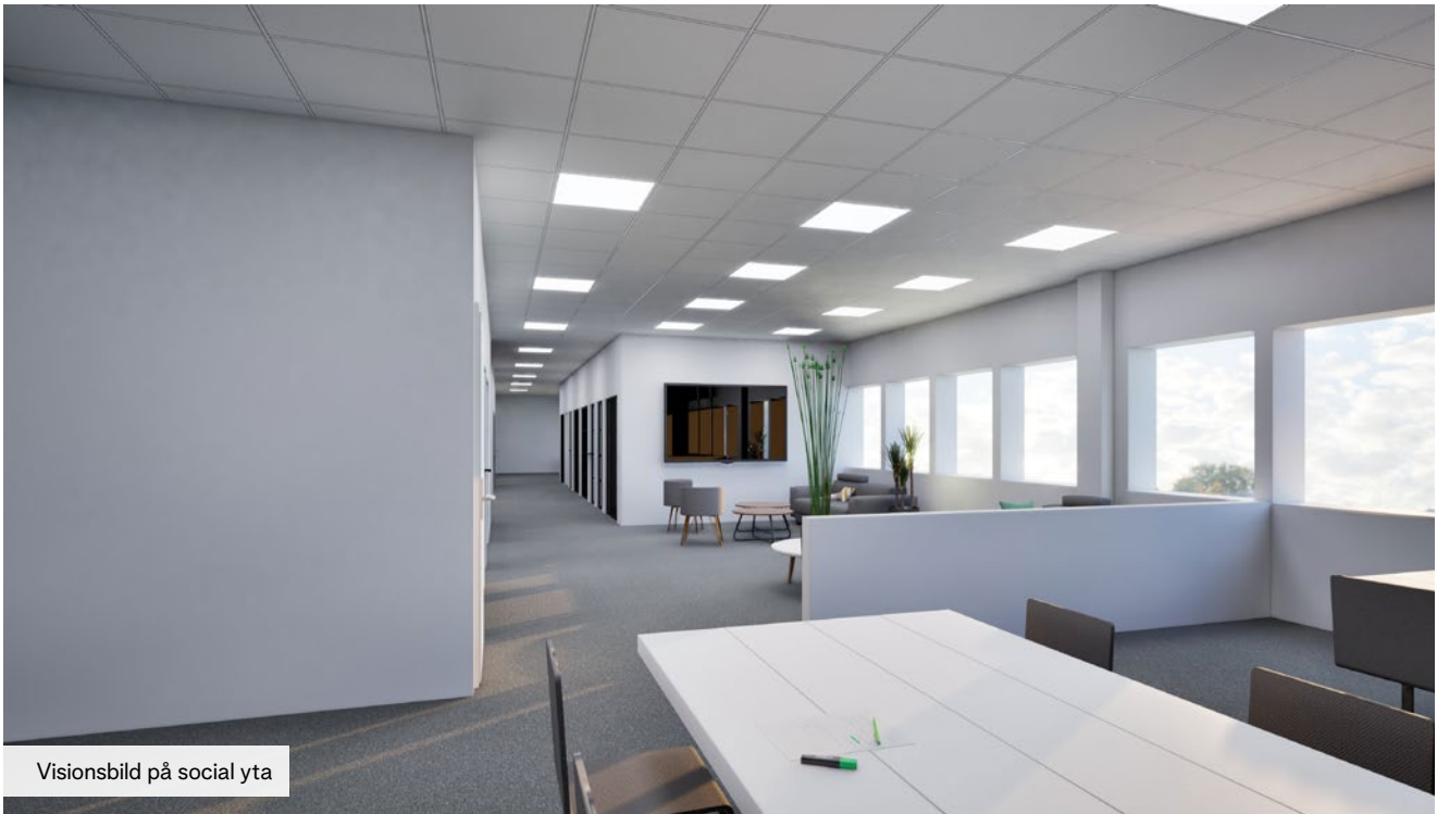
Visionsbild på social yta