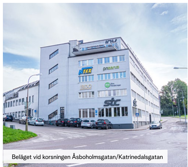
Beläget vid korsningen Åsboholmsgatan/Katrinedalsgatan