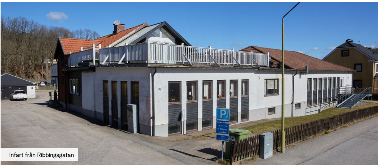
Infart från Ribbingsgatan