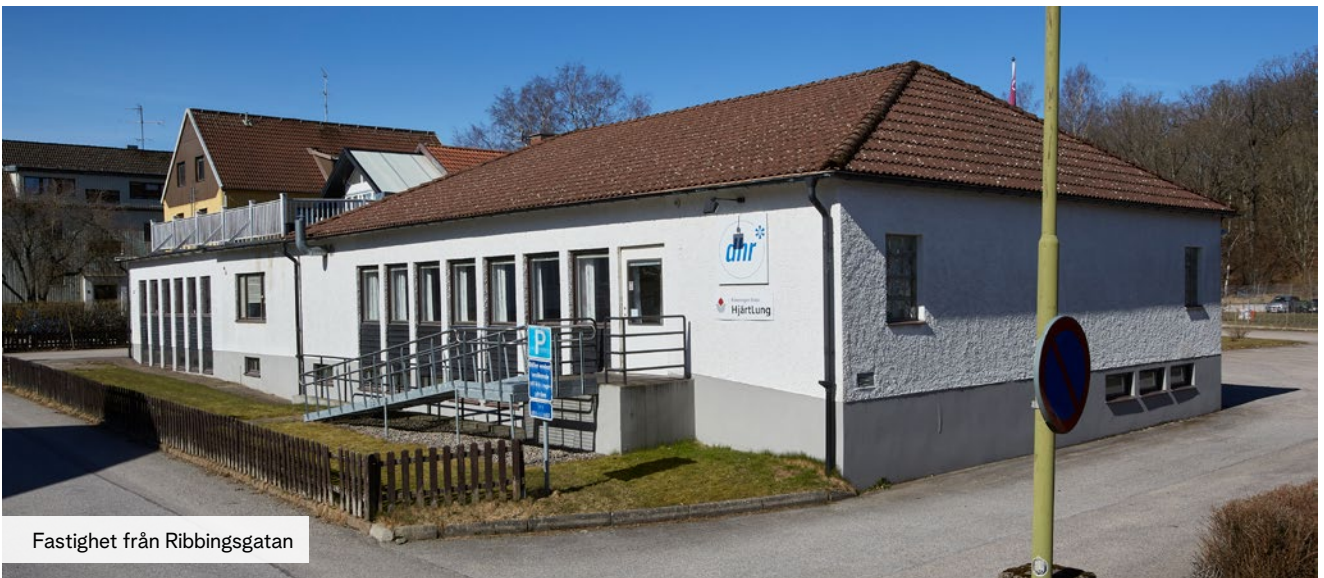
Fastighet från Ribbingsgatan