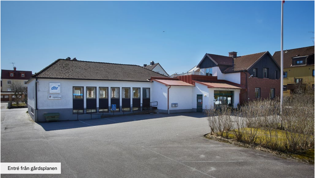
Entré från gårdsplanen