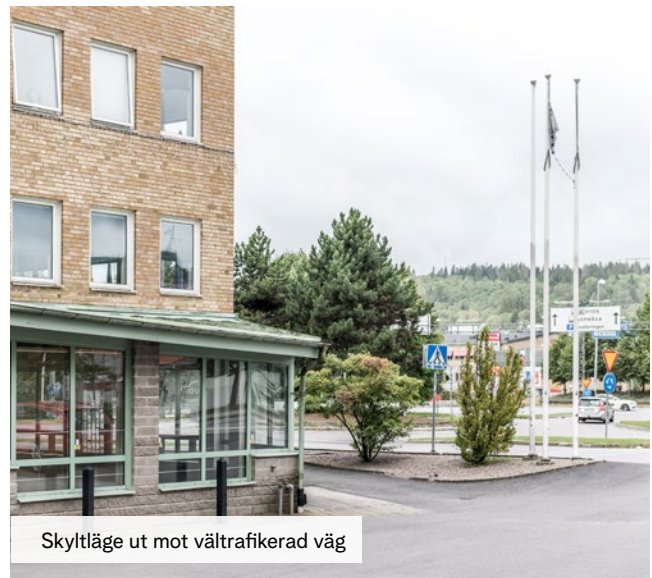
Skytlläge ut mot vältrafikerad väg