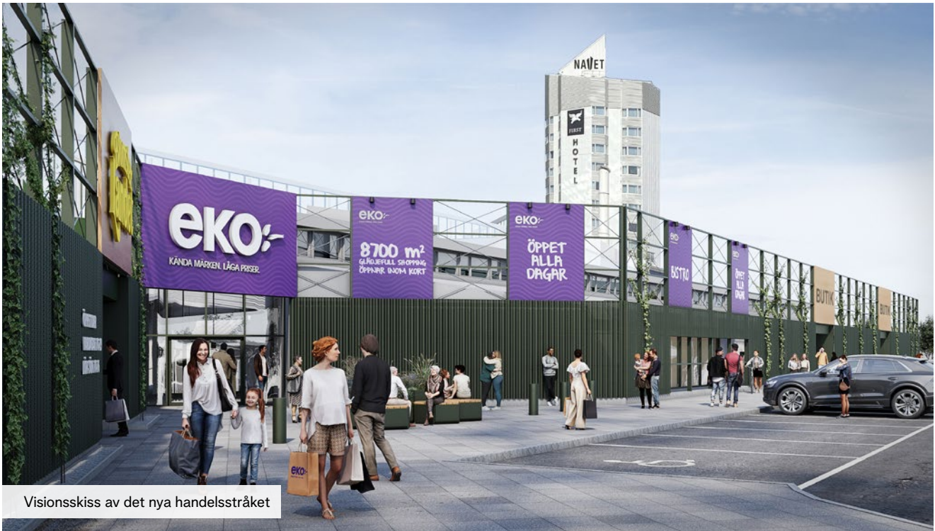
Visionsskiss av det nya handelsstråket