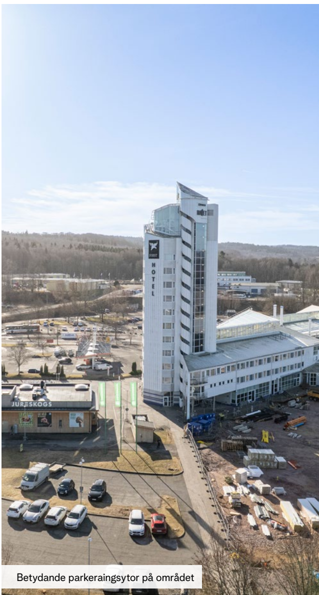
Betydande parkeringsytor på området