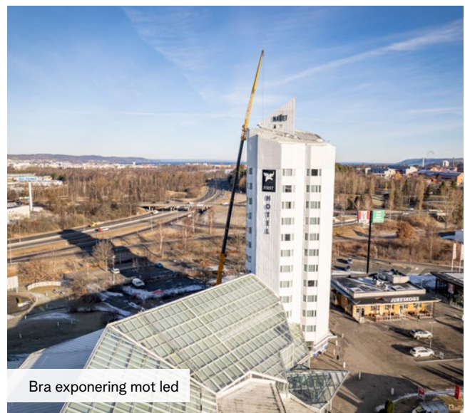
Bra exponering mot led