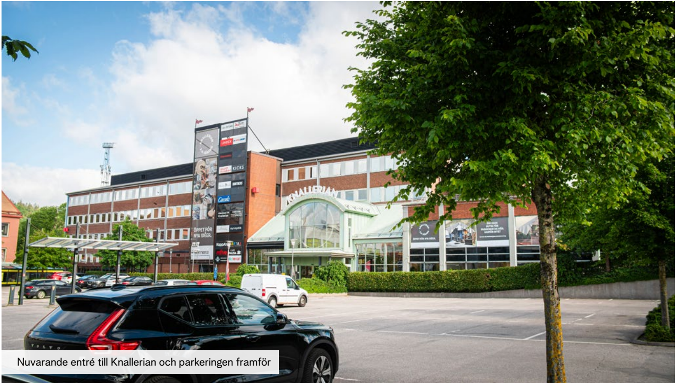
Nuvarande entré till Knallerian och parkeringen framför