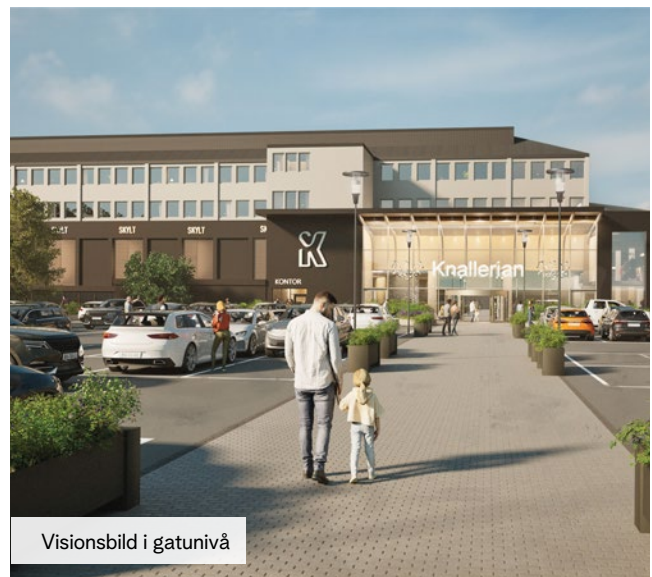
Visionsbild i gatunivå