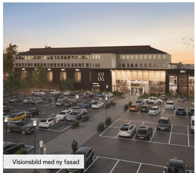
Visionsbild med ny fasad