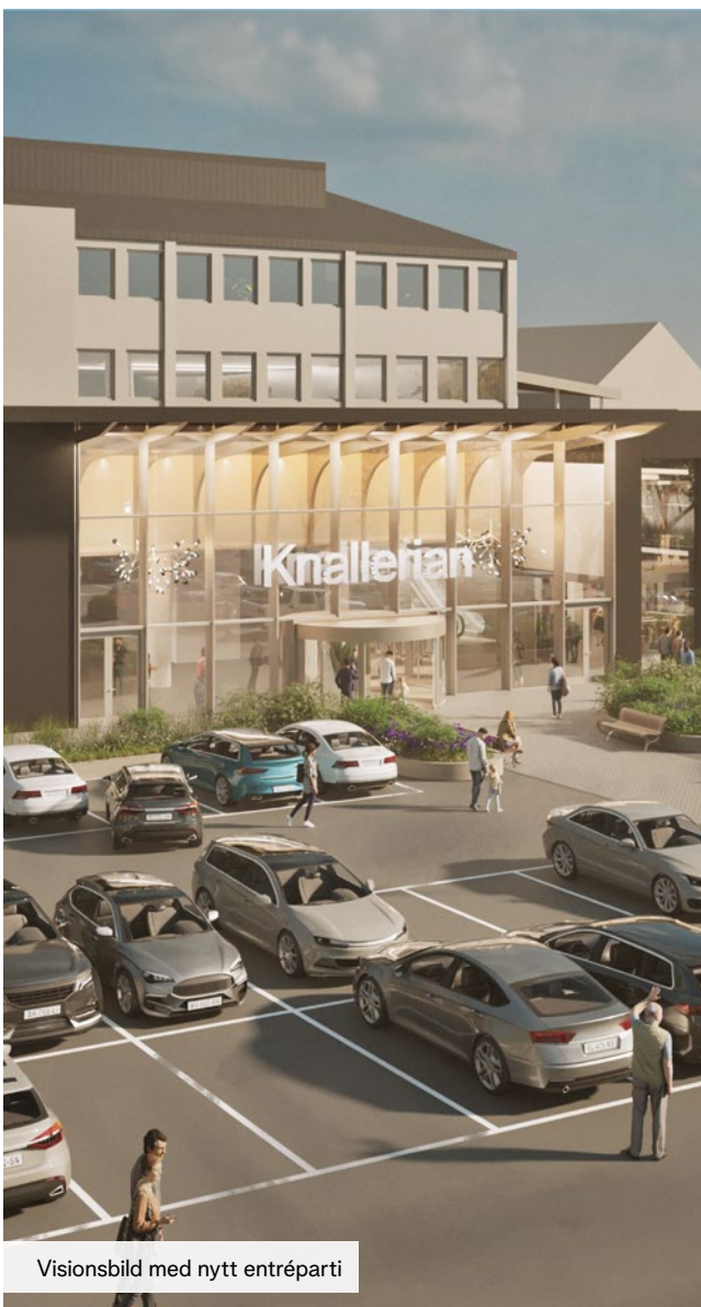
Visionsbild med nytt entréparti