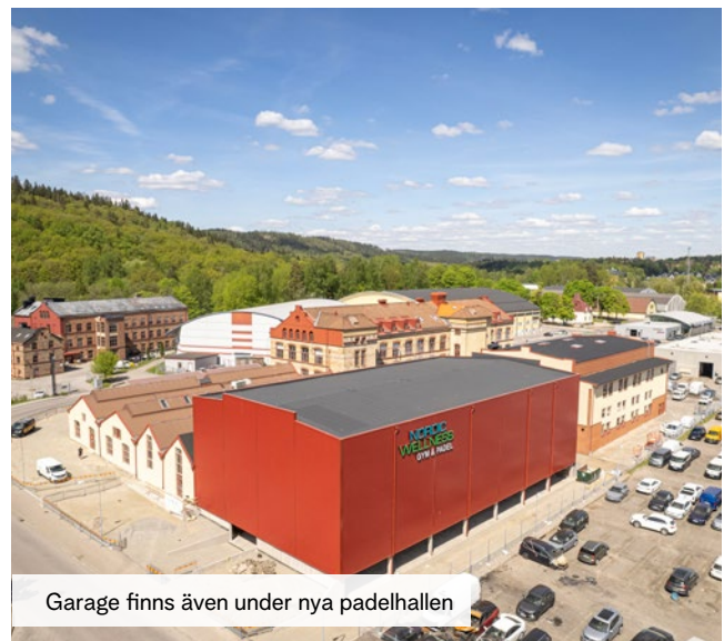
Garage finns även under nya padelhallen