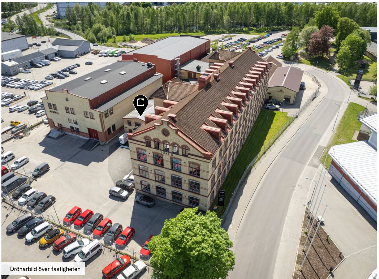
Drönbild över fastigheten