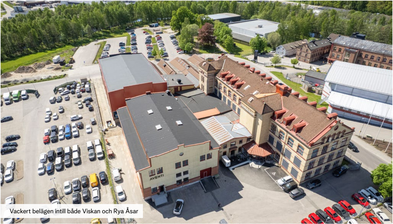
Vackert belägen intill både Viskan och Rya Åsar