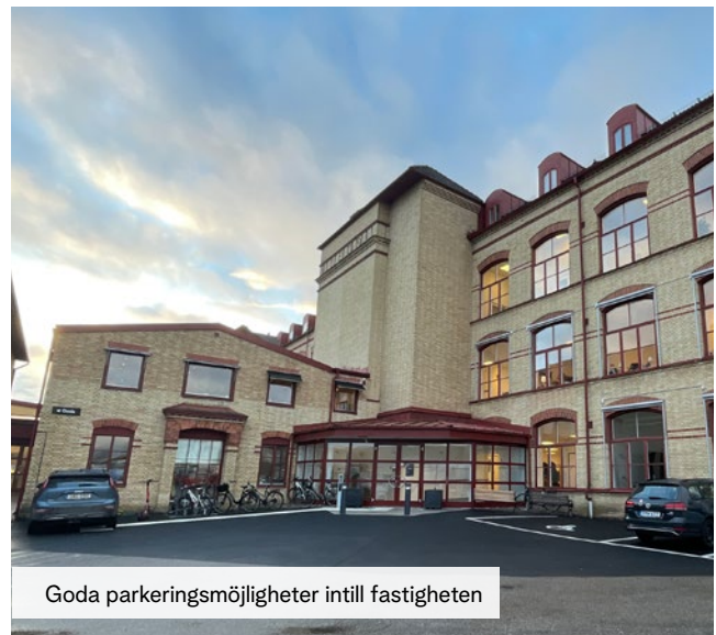
Goda parkeringsmöjligheter intill fastigheten