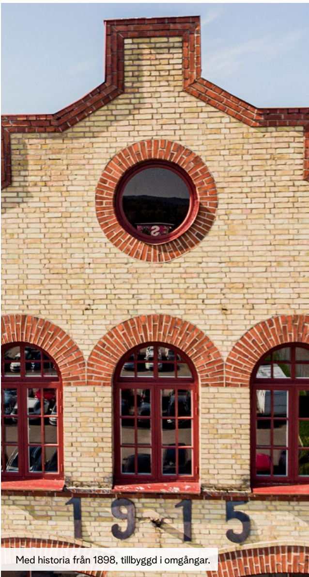
Med historia från 1898, tillbyggd i omgångar.