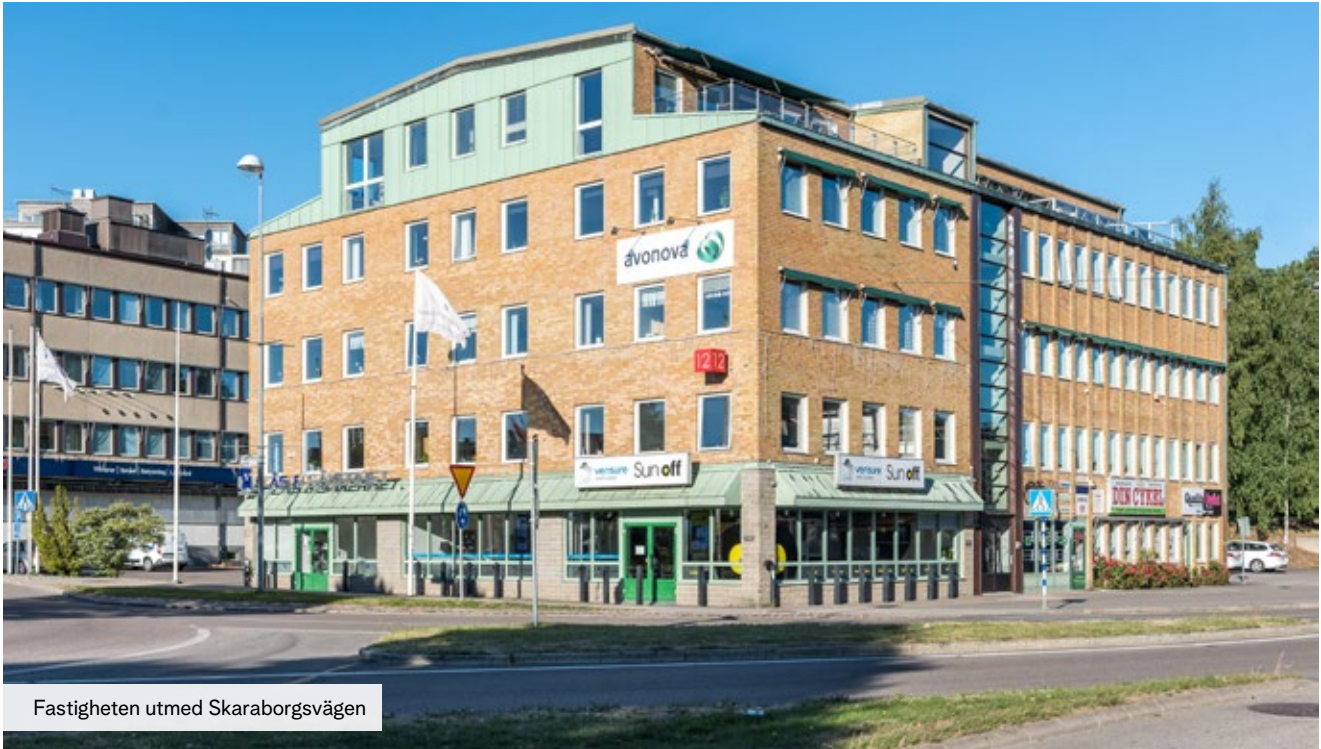
Fastigheten utmed Skaraborgsvägen