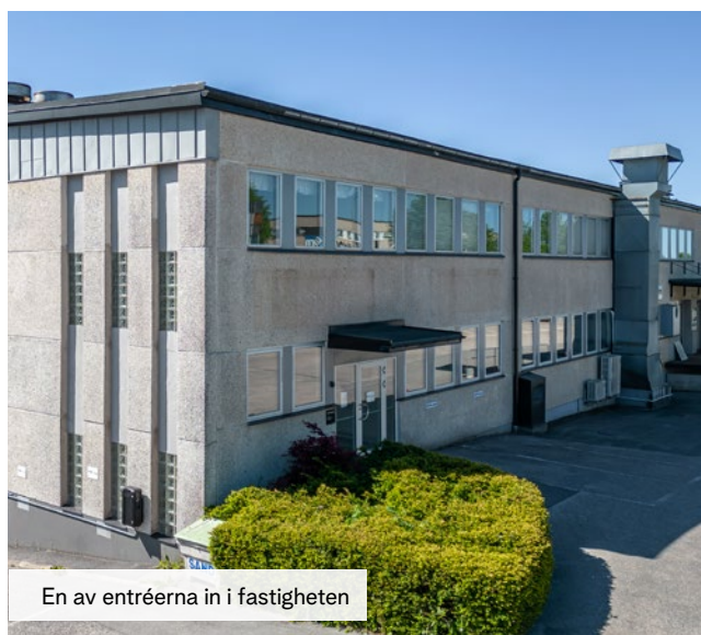
En av entréerna in i fastigheten