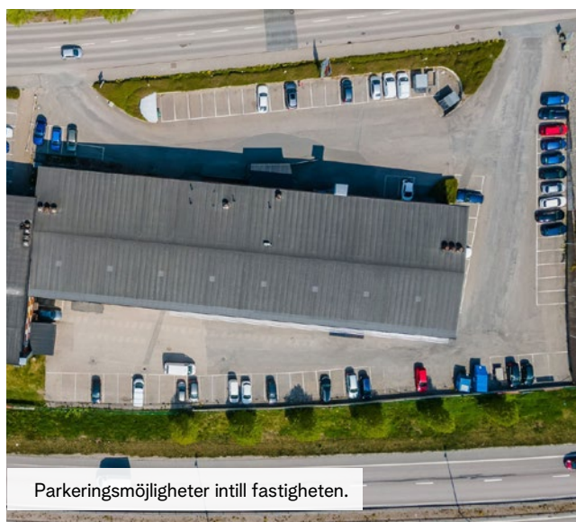
Parkeringsmöjligheter intill fastigheten.