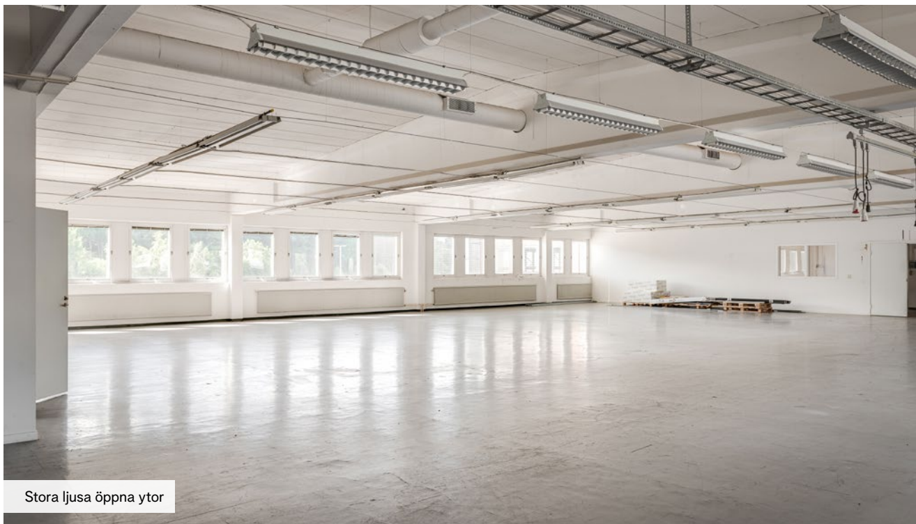
Stora ljusa öppna ytor