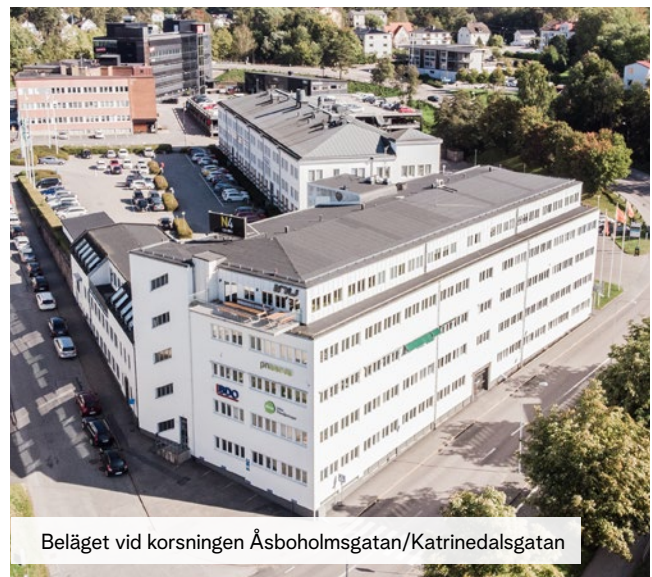
Beläget vid korsningen Åsboholmsgatan/Katrinedalsgatan