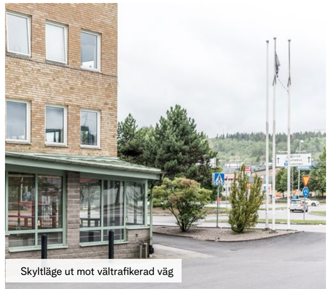
Skytlläge ut mot vältrafikerad väg