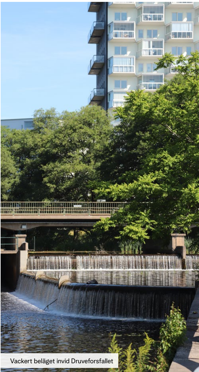
Vackert beläget invid Druveforsfallet