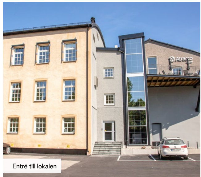
Entré till lokalen