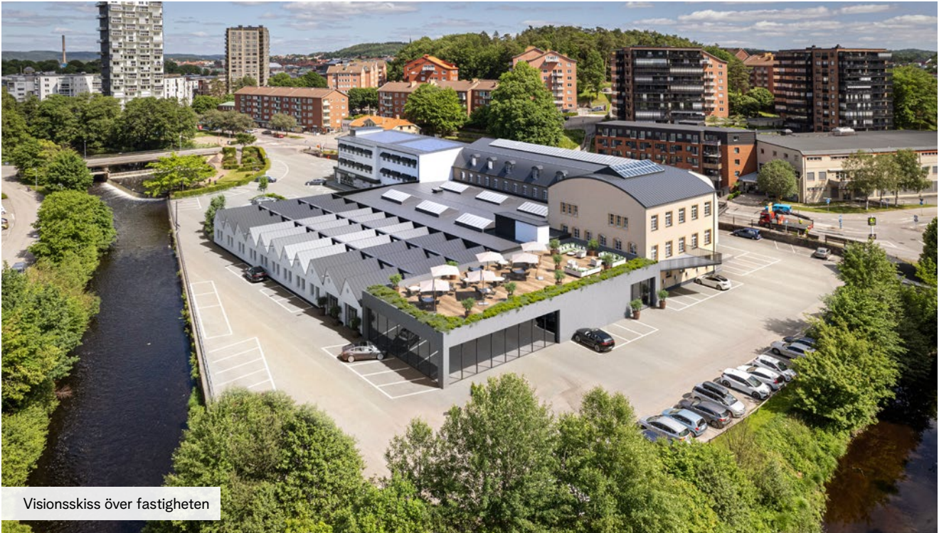
Visionsskiss över fastigheten