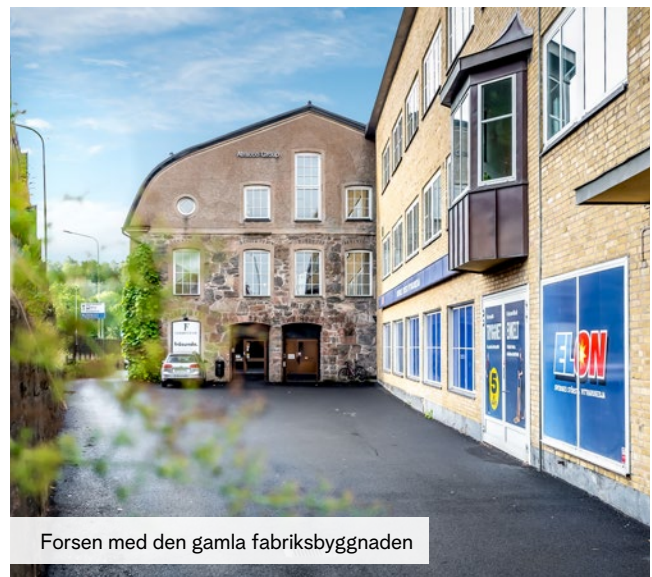
Forsen med den gamla fabriksbyggnaden