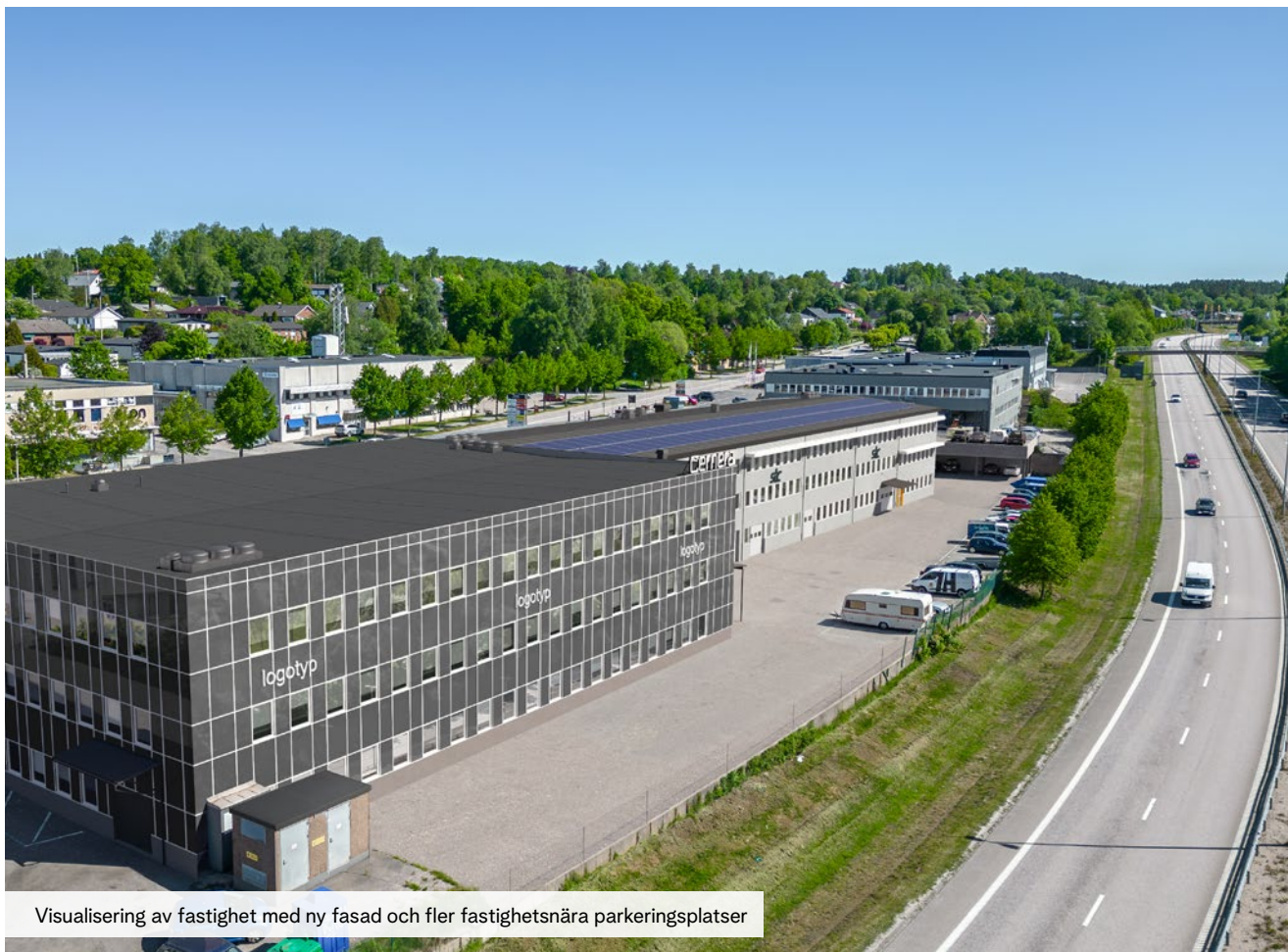
Visualisering av fastighet med ny fasad och fler fastighetsnära parkeringsplatser