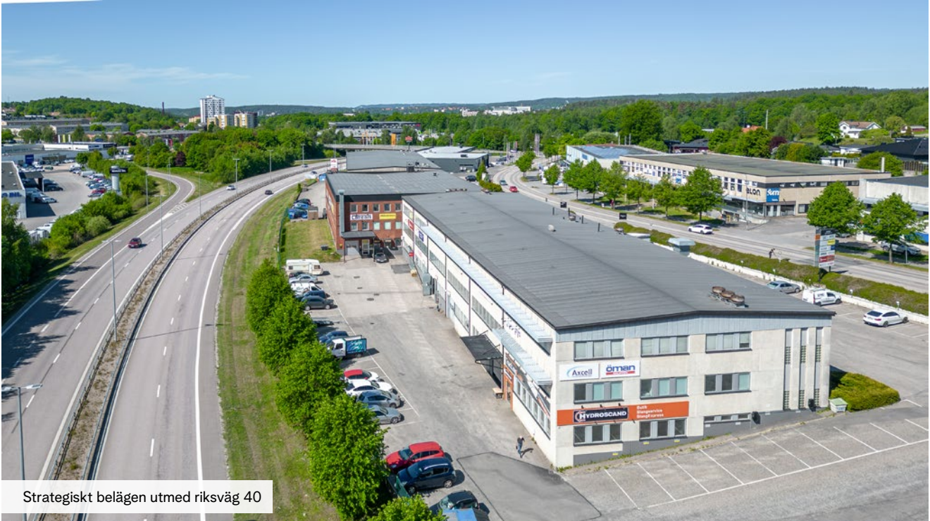
Strategiskt belägen utmed riksväg 40