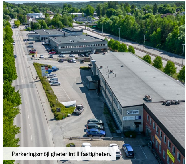
Parkeringsmöjligheter intill fastigheten.