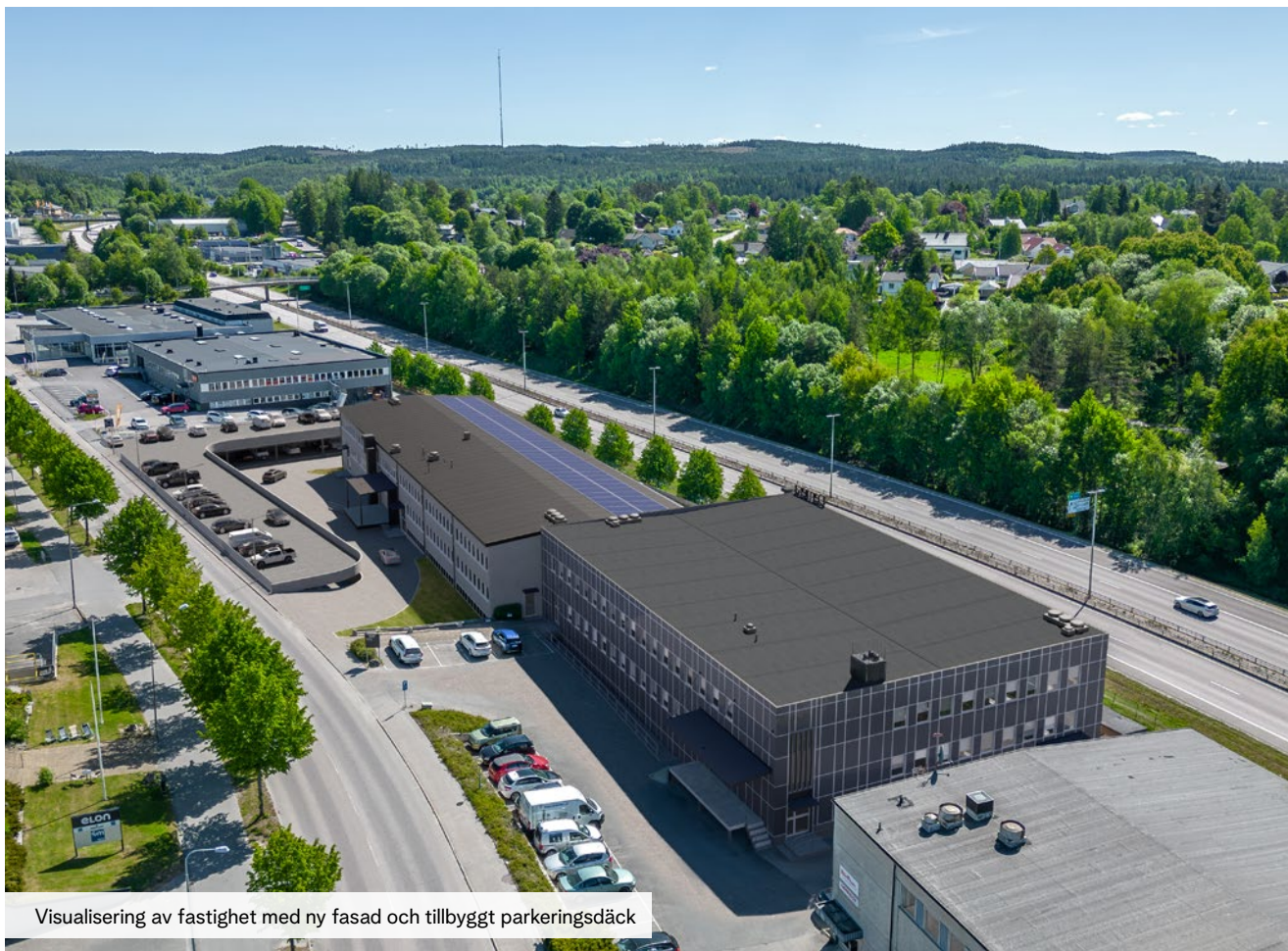
Visualisering av fastighet med ny fasad och tillbyggt parkeringsdäck