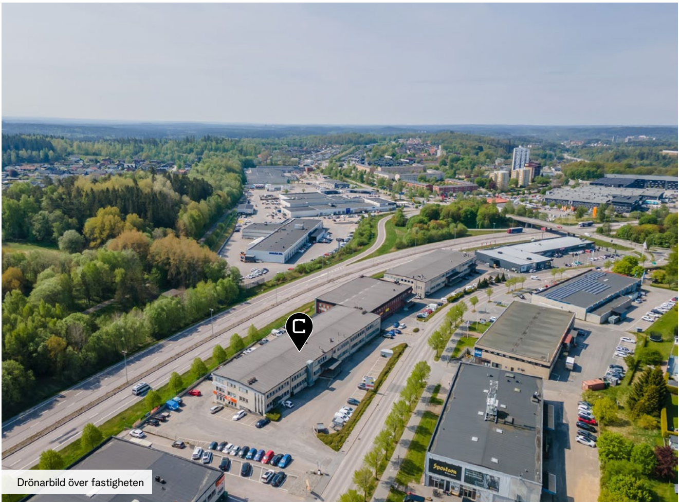
Drönarbild över fastigheten