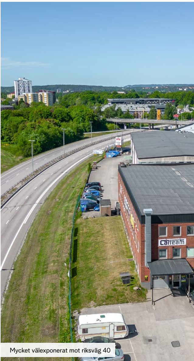
Mycket välexponerat mot riksväg 40