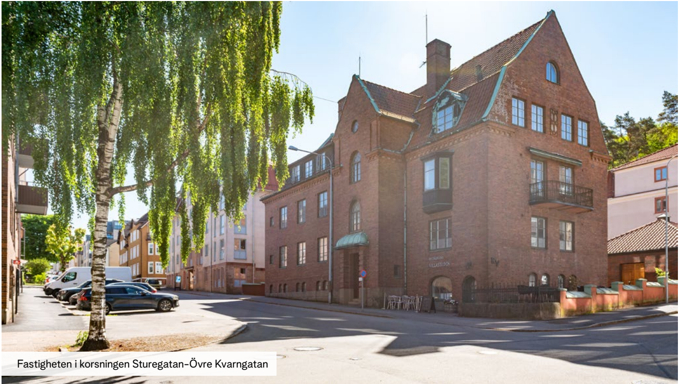
Fastigheten i korsningen Sturegatan-Övre Kvarngatan