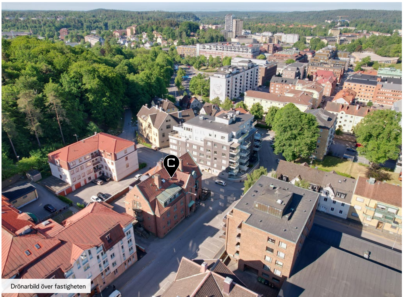
Drönarbild över fastigheten