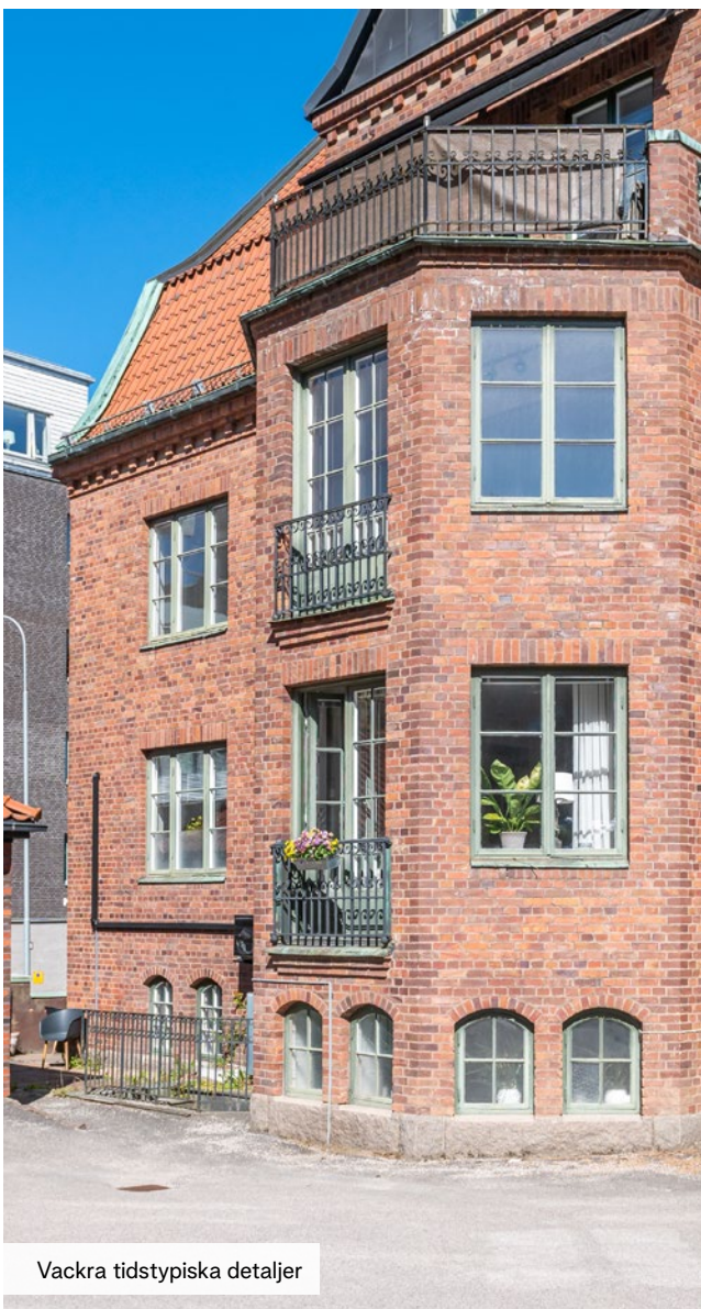
Vackra tidstypiska detaljer