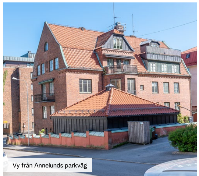
Vy från Annelunds parkväg