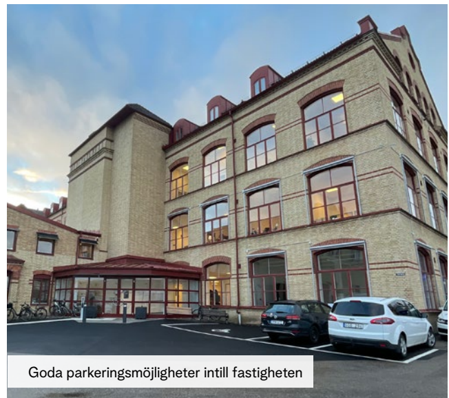
Goda parkeringsmöjligheter intill fastigheten