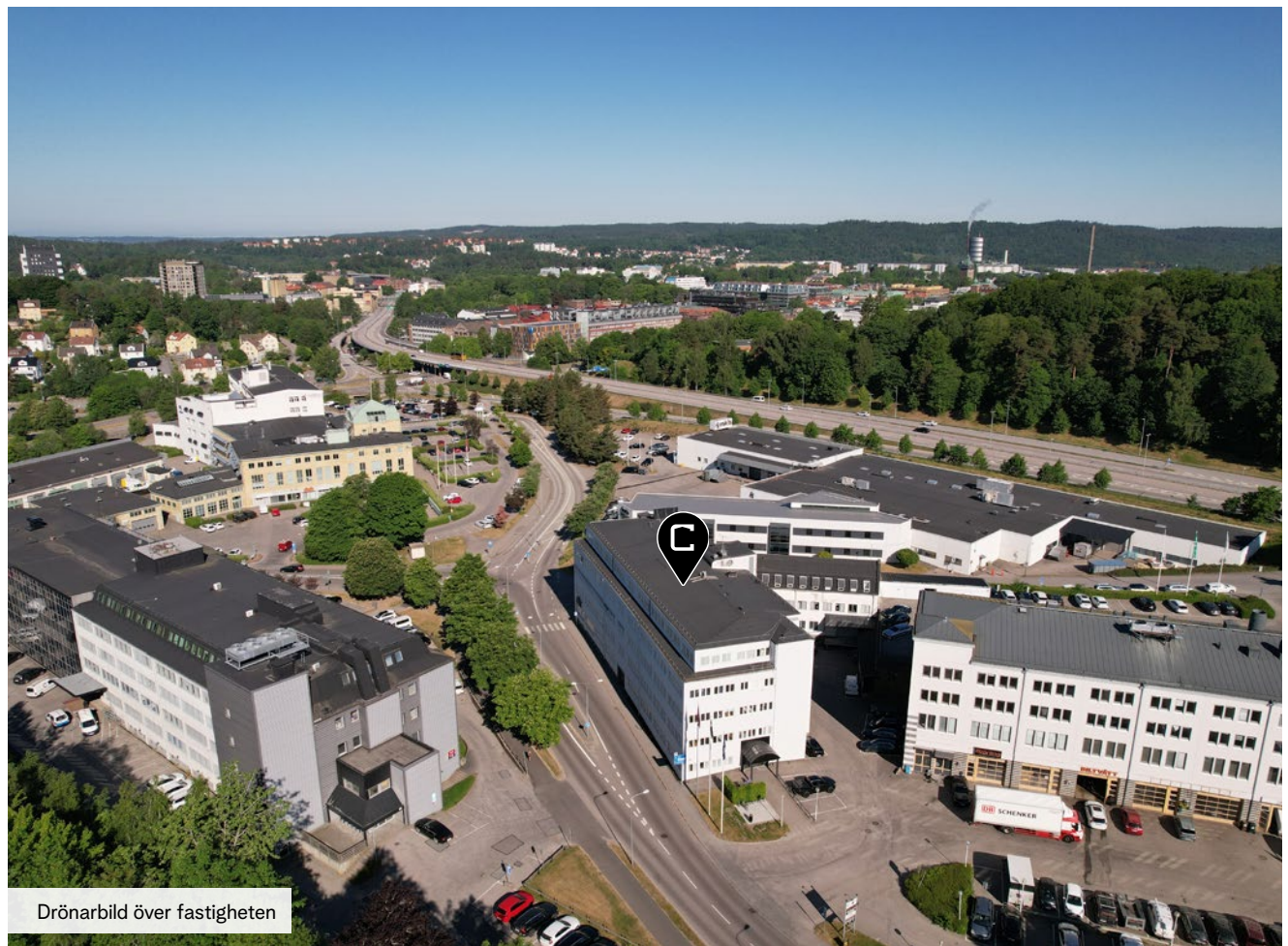
Drönbild över fastigheten