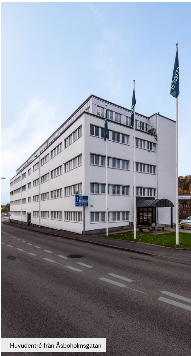
Huvudentré från Åsboholmogatan